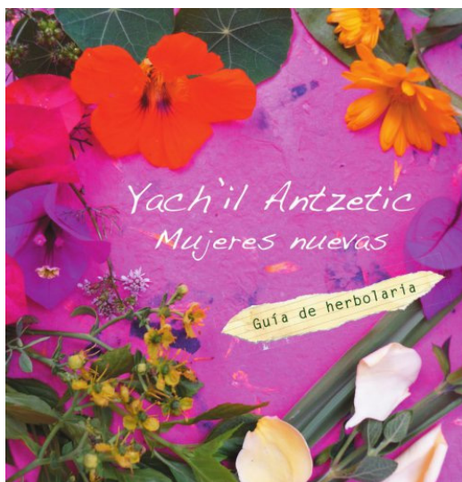
Portada de manual de herbolario de Yachil Antzetik

(CIAM y K'inál Antsetik). Estos proyectos o programas cubren los niveles cultural y simbólico.