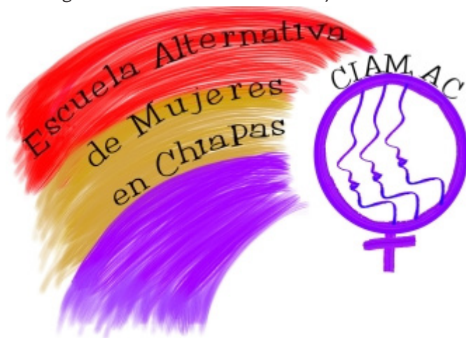
Logo de la Escuela Alternativa de Mujeres del CIAM

para las mujeres a una vida libre de violencia, 19 participación política y tierra y territorio. La manera como se trabaja pasa, en algunos casos, por la defensa, es decir, por una actuación jurídica, la cual puede tener como enfoque —tal es el caso del CDMCH— involucrar a las mujeres para que el proceso de defensoría sea un proceso de toma de conciencia sobre las causas que originaron el problema por el cual se apela. En mayor medida, la noción de los derechos tiene que ver con procesos de sensibilización, formación y toma de conciencia para que las mujeres los ejerzamos, sepamos cómo defendernos y cómo hacerlos valer desde la cotidianidad. Desde la antropología jurídica se diría que se trata de una visión de crítica del derecho, la cual introduce el paradigma de género. En este sentido, todas las organizaciones reportadas indican que realizan labores de información con las mujeres con quienes trabajan, esto como una estrategia para que ellas conozcan, ejerzan y defiendan sus derechos al tiempo que van desarrollando su agencia.