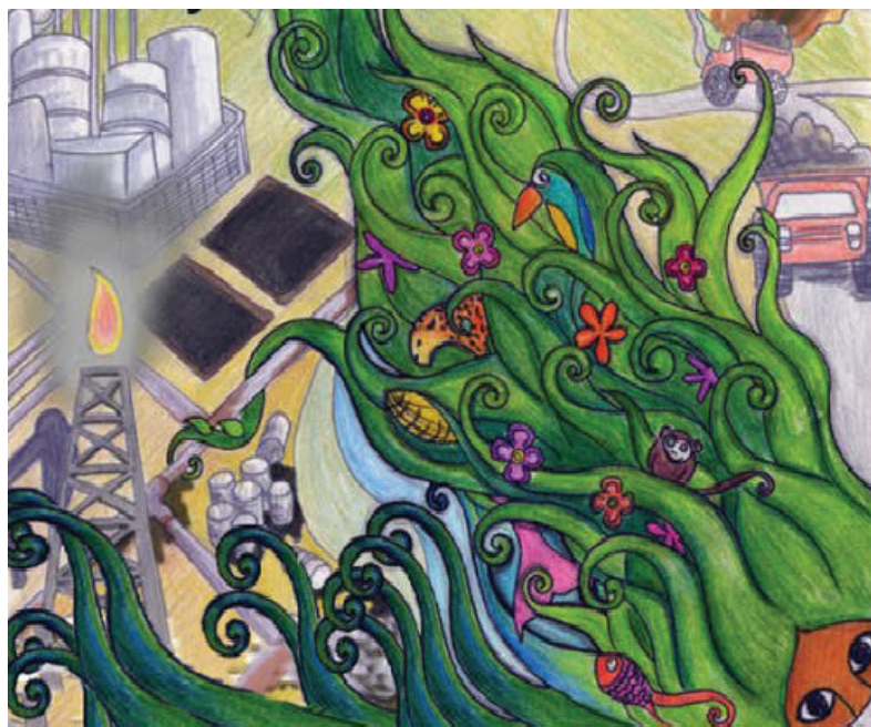
Ilustración industria vs. campo

Así, la lógica capitalista sobre la tierra y el territorio tiene que ver con lo señalado en el capítulo anterior, ya que las organizaciones entrevistadas, no sólo de mujeres, declaran que las amenazas sobre la tierra y el territorio en Chiapas se relacionan en un 60.6% con megaproyectos de infraestructura, extractivismo y reconversión de los cultivos. Ante esta realidad, las organizaciones de mujeres se han abocado, sobre todo, a informar a las mujeres con quienes trabajan acerca de estas amenazas y los problemas concretos que ya existen. Como hemos señalado, todas las organizaciones trabajan en mayor o menor medida con mujeres rurales, indígenas o campesinas, y es por eso que, aun cuando no trabajen directamente sobre los problemas ligados a la tierra y al territorio, sí participan en marchas, plantones y bloqueos para protestar. En esta situación están organizaciones como CIAM, COFEMO y K'inál Antzetik.