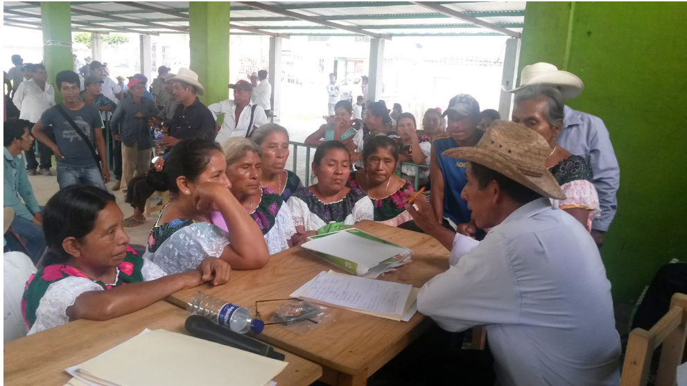
Fotografía: Mauricio Arellano Nucamendi, junio de 2016.

La costumbre de que las mujeres viudas o madres solteras no pueden tener tierras se vive con frecuencia como un hostigamiento sistemático contra ellas, hasta lograr despojarlas de sus tierras o de una parte de éstas. En las entrevistas registramos que la mitad de las organizaciones (37) han conocido al menos un caso de despojo hacia las mujeres, en su mayoría cometidos por familiares (16) o por la asamblea ejidal o comunal (7) o ambos (7), sólo en algunos casos se ha señalado al gobierno o a prestamistas como los autores del despojo. En la región Fronteriza se denunció que muchas familias arriesgan sus tierras en las casas de empeño que abundan por todas partes y que son varios los casos en los que ya no pueden pagar la deuda y se quedan sin tierras. La manera como las organizaciones entrevistadas tratan los temas de despojo de tierras cometidos hacia mujeres nos da una idea del escaso trabajo de denuncia que llevan a cabo las organizaciones en relación con los derechos de las mujeres a la tierra/territorio, así como la individuación del problema, en tanto que las