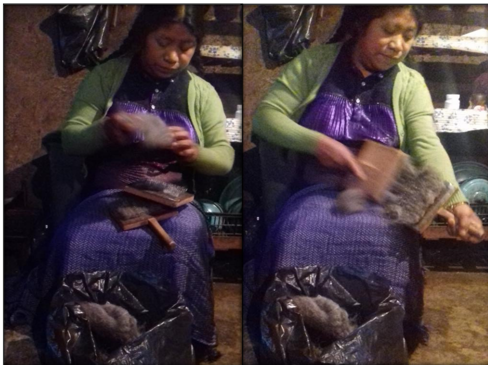
Figura 6. Mujer tsotsil cardando lana.

fuerza sobre el instrumento para que se pueda peinar bien la lana y no queden bolas que pueda afectar al momento de hilar. Figura 6.