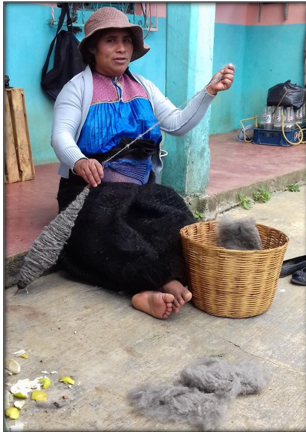
Figura 7. Mujer tsotsil hilando lana

Para iniciar esta actividad ya se debe de tener lista los bloques de lana cepillada, una vez que se tenga se comienza a hilar y se toma un extremo del cuadro de lana colocándolo sobre la base del malacate, después se gira el instrumento tomándolo desde la punta de este y se inicia a jalar lentamente la unidad de lana que se tiene, cuando está a punto de terminar el material se toma otra cantidad de lana y se une al resto , esto se realiza con la finalidad que se pueda formar los rollos de hilo de lana. Así sucesivamente se ejecuta la misma técnica hasta terminar la materia prima que se tenga designado para formar los rollos de hilo. Figura 7.