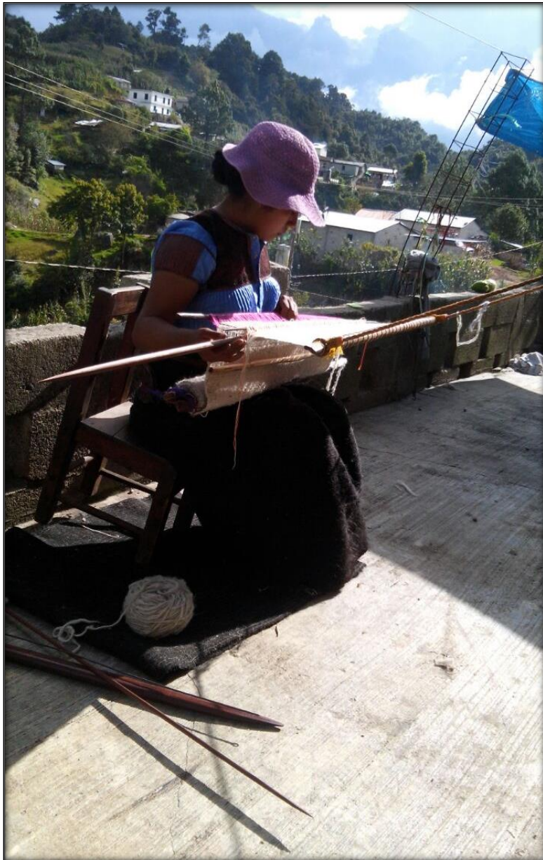
Figura 10. Joven tsotsil tejiendo un atuendo

Las mujeres utilizan únicamente las herramientas de madera y sus manos y dedos que son los que le ayudan a separar, pasar, distribuir, jalar y dividir los hilos que formaran el tejido. Las mujeres de Cruz Quemada tardan aproximadamente una semana o quince días en realizar una enagua, esto dependerá del tiempo que se le dedique a este trabajo.