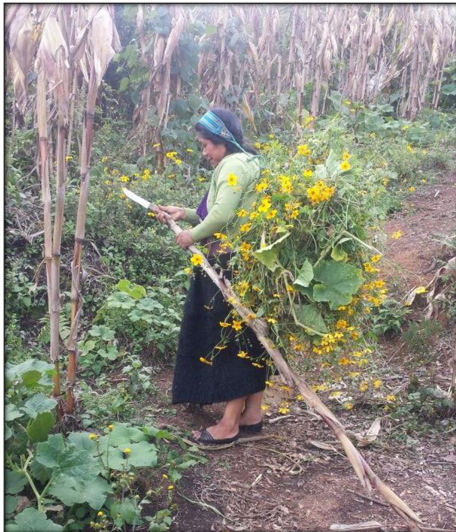
Figura 4. Mujer tsotsil en la milpa, obteniendo alimento para el rebaño

el rebaño y para eso van a la milpa a traer diversas hiervas en especial una que se produce dentro de ella llamada matoz, esta planta crece por si sola y cuando se seca sus semillas se dispersan por toda la milpa y vuelve a reproducirse, así también la hoja de calabaza y las hojas del maíz es utilizada para alimento de los ovinos. Figura 4. Esta actividad de conseguir el alimento a los animales también es llevada a cabo cuando las mujeres no pueden llevarlos a los campos y optan por alimentarlos dentro del corral o fuera de esta.