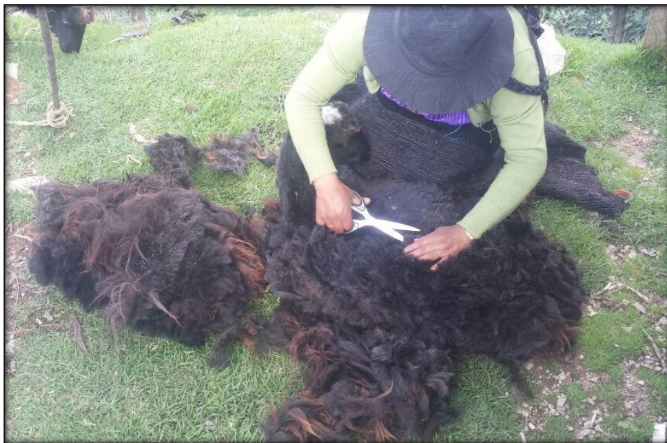
Figura 5. Mujer tsotsil llevando a cabo la trasquila de un borrego.

Teniendo en cuenta que no se necesita alta tecnología para trasquilar a los animales también la técnica para llevarlo a cabo es sencilla, para ello en primer lugar hay que amarrar las cuatro patas del borrego y acostarlo en el suelo a modo de que este inmóvil. Posteriormente se comienza a cortar la parte de la panza llegando hasta la espalda por último se termina por las patas, no se deja ningún espacio con pelo se les corta completamente todo, se obtiene aproximadamente tres a cuatro kilos de lana por cada ovino que es trasquilado. Figura 5.