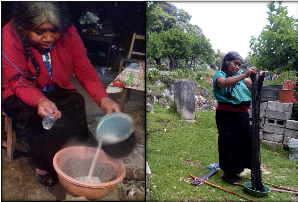
Figura 11. Mujer tsotsil, realizando el tratamiento de la lana.

El proceso para realizar la mezcla del almidón es muy sencillo y consiste únicamente se pone a cocer el maíz y cuando ya está cocido se muele a modo que quede en masa, en el momento que ya se tiene la masa se pone a hervir con agua durante diez minutos. Finalmente cuando la mezcla ya está lista se pone en una bandeja grande para que se remoje por completo todo el hilo y se deja reposar aproximadamente veinte minutos, después del tiempo que se asignó para que impregnara todo el almidón se retira y se cuelga en un lugar donde puedan entrar los rayos del sol y se pueda secar por completo. Figura 11.