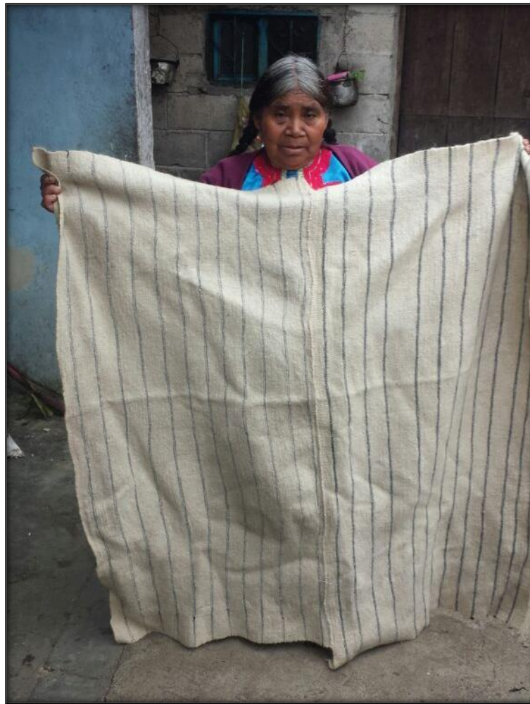
Figura 9 Mujer tsotsil presentando la sabana que se utilizaban anteriormente.