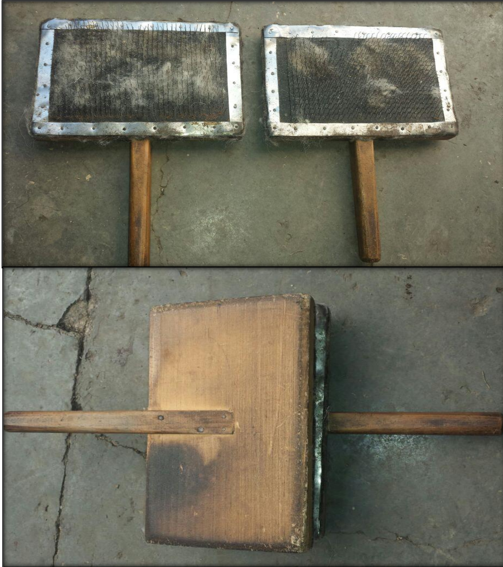
Figura 12. Herramienta tradicional para cardar “calax” o “cardo”.

El precio de esta herramienta varia porque se puede obtener en tres tamaños y de esto dependerá el costo, el grande tiene un precio de quinientos pesos, el mediano trecientos pesos y el chico cien pesos. El más usado es el grande y el pequeño únicamente se les compra a las niñas que están aprendiendo a utilizarlo a la edad de tres y cinco años. Este instrumento puede durar varios años a pesar del ardua trabajo que se realiza con ello, la duración aproximadamente oscila entre los cinco años después de este tiempo las mujeres tienden a