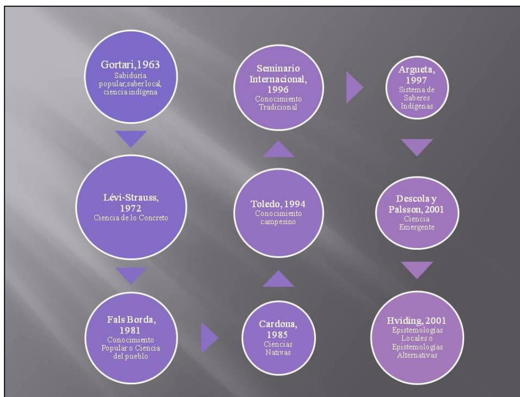
Figura 2 Evolución del término Saberes Locales, información obtenida del texto de, Pérez y Argueta (2011).

conocimiento local, cada año el termino iba evolucionando y en algunos coincidían en alguna parte. Figura 3.