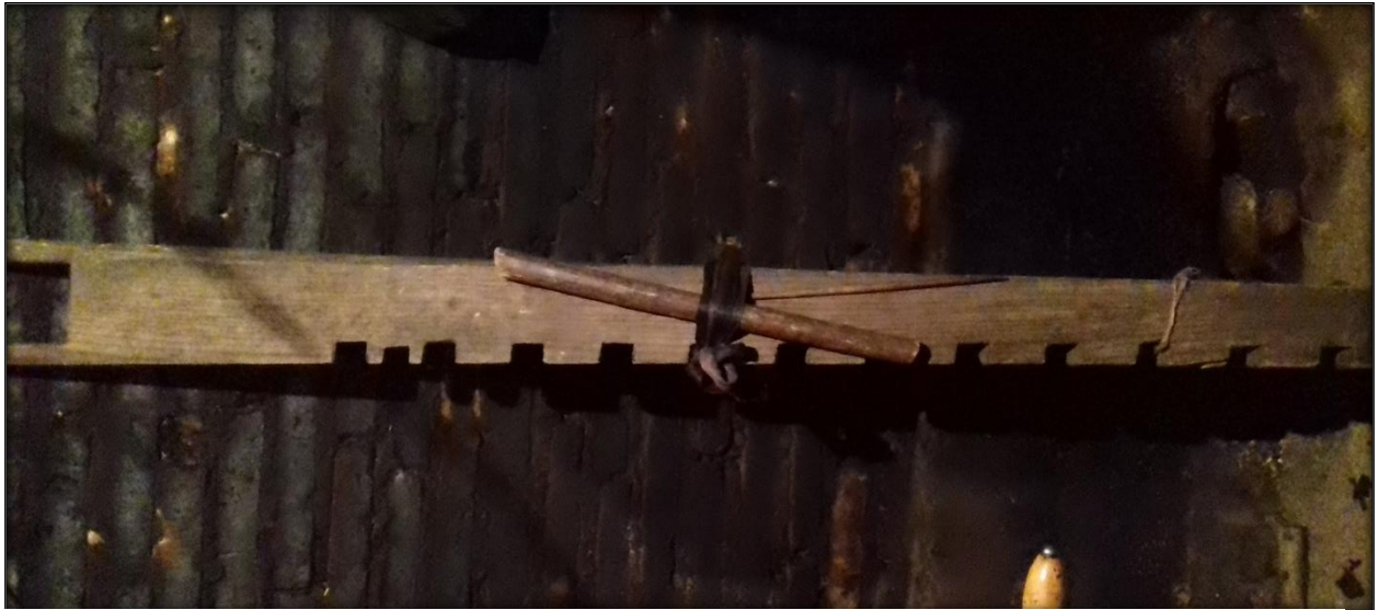
Figura 13. Herramienta para realizar la urdimbre.

Los seis palos de madera miden un metro de largo y el grosor y la forma van a variar, los dos primeros son del mismo grosor y forma y sirven para la base del telar uno para cada extremo, tres de los palos son del mismo grosor y forma su función es ir separando la lana y los hilos de colores que se entrelazan en el tejido, uno de los palos tiene forma circular y es donde esta enredado toda la lana que se necesitara y el ultimo es un palo plano que mide seis centímetros de ancho y tiene punta ancha en ambos lados tomando forma de un triángulo únicamente en la punta el trabajo de este es ir comprimiendo el tejido.