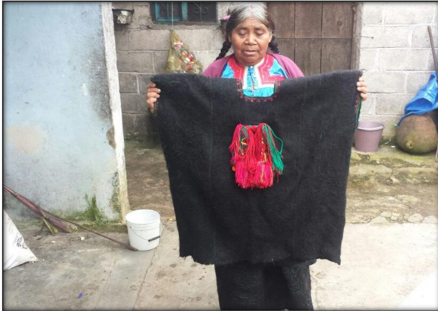
Figura 8. Mujer tsotsil presentando la blusa original de la cultura tsotsil Chamula. En la fotografía se muestra la prenda que utilizaban las mujeres anteriormente.