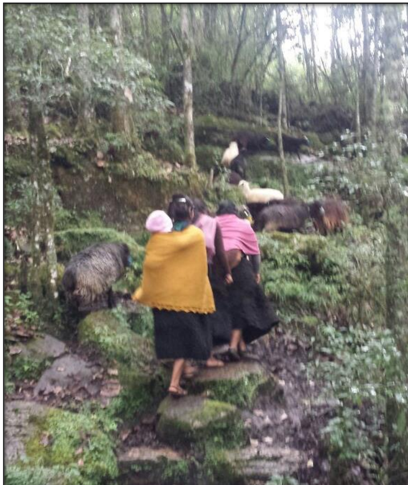
Figura 3 Inicio del pastoreo

Cuando inicia el recorrido a los borregos se les pone un bozal esto con la finalidad de no entretenerse en el camino y para que no coman ni destruyan las milpas, anteriormente estos bozales eran elaborados por las propias mujeres utilizando material de la región, se elaboraba con zacate que se podía encontrar por donde quiera ahora son comprados en el mercado local. Cuando han llegado al campo, lugar donde permanecerán todo el día se les quita los bozales a los animales y se les deja libre, otras mujeres prefieren enterrar estacas y amarrar a los borregos de las patas de tal manera que no se escapen y los puedan tener a la vista.