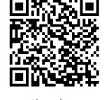
Clan de Entomología