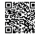
Clan de Orquideología