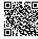
Clan de Campismo