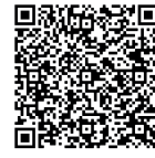
Clan de Biotecnología