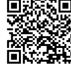
Clan de Educación Ambiental