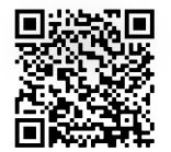
Clan de Vida Marina