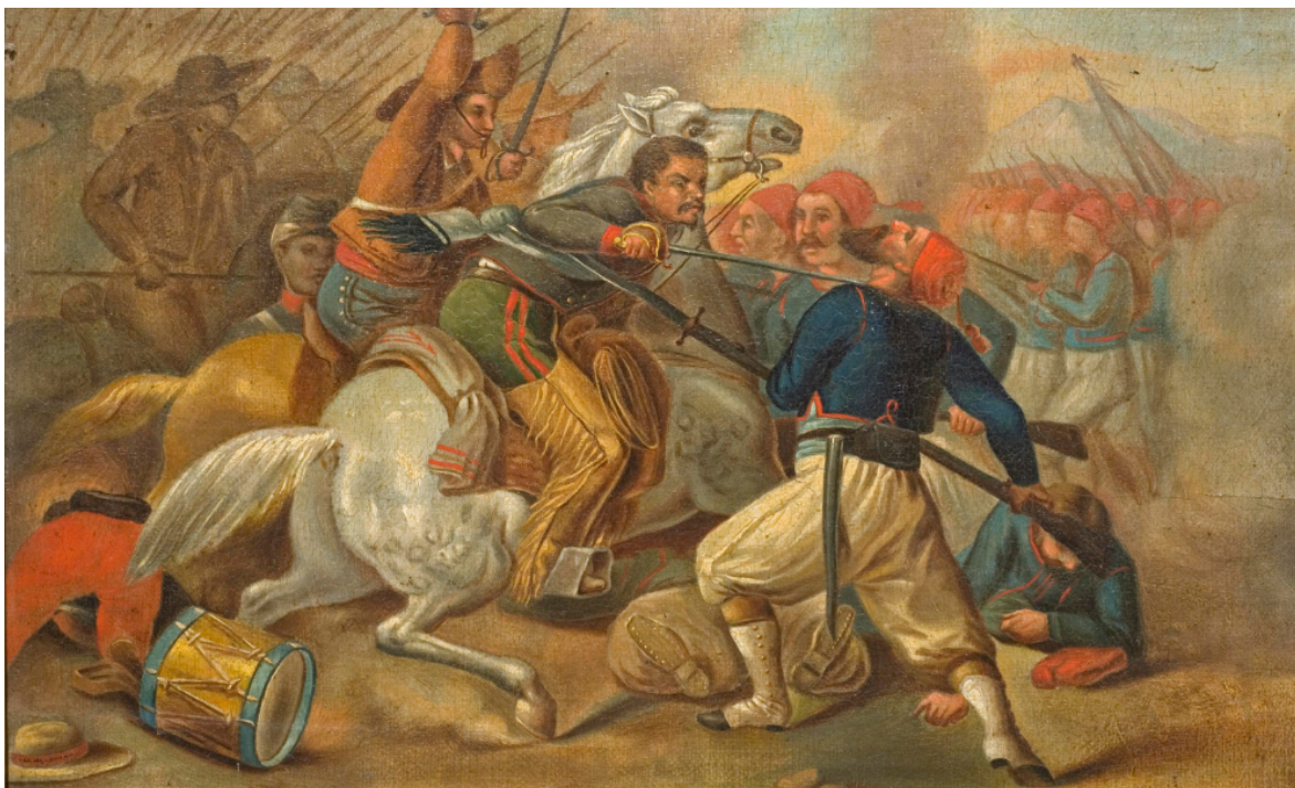
IMAGEN 2. Autoría desconocida, siglo XIX, Óleo sobre tela, 30 x 40 x 4 cm.