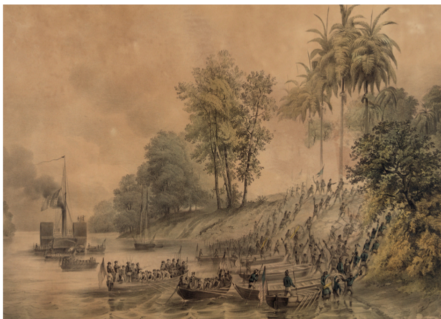
Imagen 1. Obra de H. Walke, El desembarco de la expedición en Tabasco , 1848, Litografía.

Según la voz general están naviando (sic) en aquel punto [...] para venir a atacar esta ciudad lo cual se espera de un momento a otro. Por mi parte opondré resistencia al enemigo hasta donde se pueda, sin embargo de tener para ello una fuerza muy insignificante en su número y si decidida a no permitir tomen posición tranquilamente de estos puntos. 100