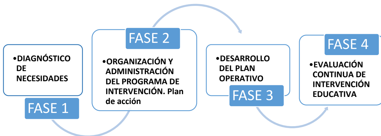
GRÁFICO No 2. FASES DEL PROGRAMA DE INTERVENCIÓN EDUCATIVA

habla de la Evaluación y seguimiento de las fases del Plan con la participación y apoyo de los sectores involucrados, Y además, de la Socialización de los resultados al finalizar el Diplomado virtual, mediante una exposición artística virtual acompañada de un catálogo digital descargable y conferencias en línea.