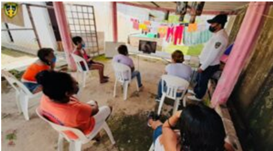
Reclusorio Femenil, Tapachula, Chiapas 2022

Tapachula cuenta con dos de estos, los cuales son el CERSS número 03 donde se atiende a la población masculina y el 04 donde se recluye a la población femenina. Ambos centros penitenciarios se encuentran a las afueras de la ciudad de Tapachula, hacia la zona oriente, se puede acceder por la carretera federal 200, rumbo a los municipios de Huehuetán y Huixtla.