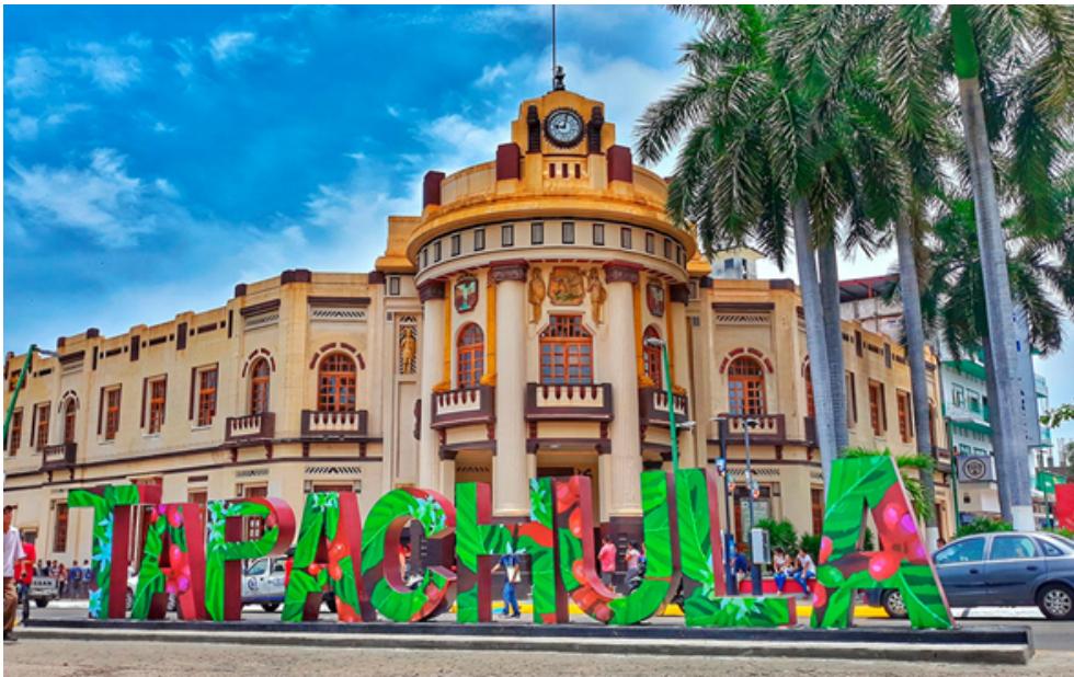
Palacio Municipal de Tapachula, Chiapas. 2022

El municipio tiene alrededor de 353,706 habitantes entre población urbana y rural. Existen diferentes parajes que caracterizan a este territorio. El municipio es una de las zonas más importantes en el Estado, por ser fronterizo y porque ahí se ubica la segunda ciudad más poblada e de Chiapas.