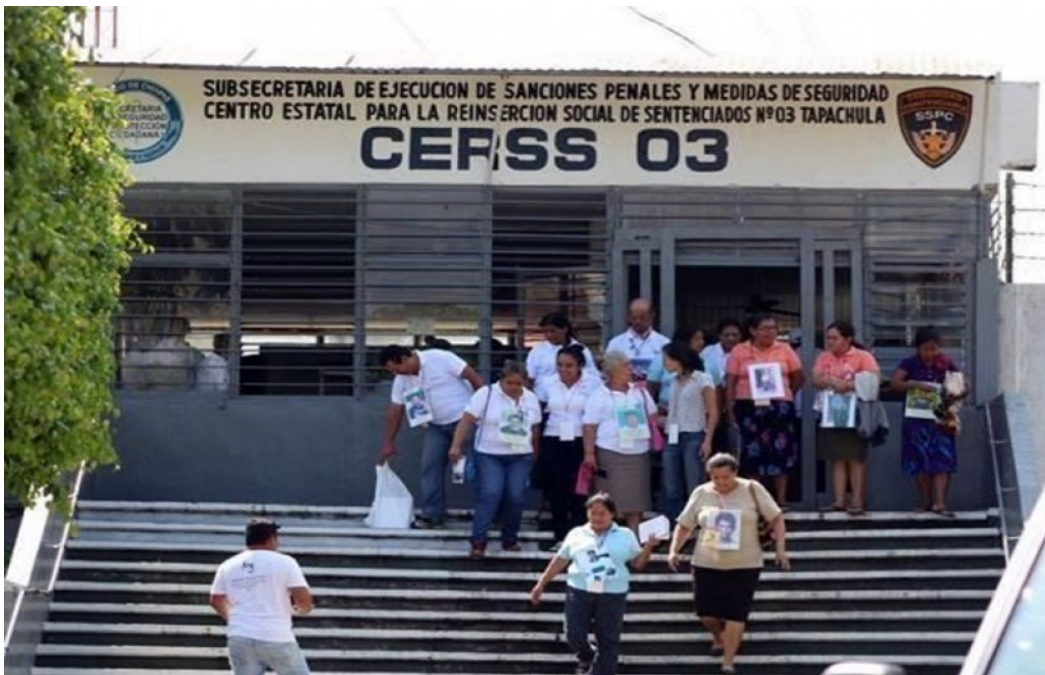
Reclusorio 03 Varonil, Chiapas 2021, Fuente Google Maps

Si bien se ha dejado claro que nuestro lugar de trabajo será la ciudad de Tapachula Chiapas, nuestro enfoque de investigación tendrá lugar en el Centro Penitenciario Reclusorio número 03 Y 04 (CERRS) que se ubica en esa cabecera del municipio.