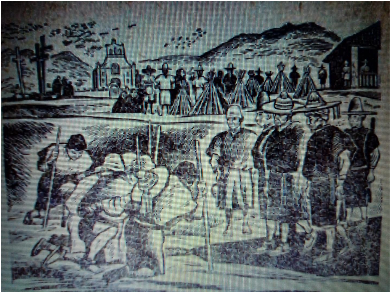
Ilustración 15. Entrega de cargos políticos y religiosos

En la siguiente imagen se observa el momento cuando le otorgan el cargo, en conjunto con otros compañeros chamulas, muestran respeto a las autoridades, los cueles se distinguen por su vestuario de lana negra y sombrero con listones de colores, aunque el primer cargo que le otorgan tiene que ver con prestar servicio a los políticos, el proceso de nombramiento es vinculado a las costumbres religiosas, lo cual se puede observar en la imagen, con la iglesia y las cruces en el fondo.