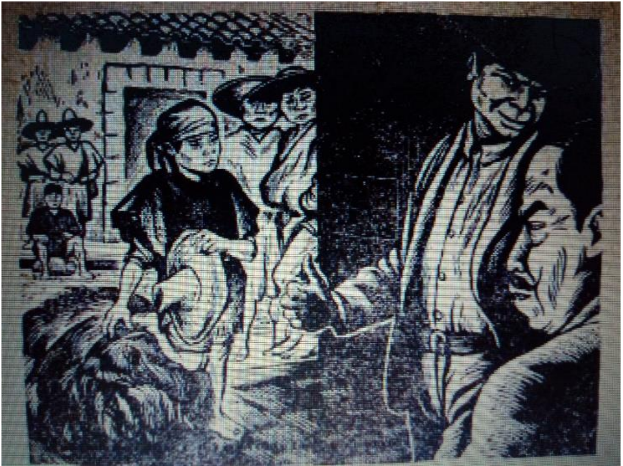
Ilustración 6. Enganchadores de las fincas

pide irse con él, para este momento si bien sigue siendo un menor ya no es “tan tierno” como al principio, porque el enganchador le da doce pesos, cuando en otras ocasiones con sólo que le dieran de comer hubiera bastado, como ocurrió con todos los patrones que tuvo antes, con los zinacantecos, los viejos que lo cambiaron por maíz y con el ladino, los cuales no le pagaban en efectivo el trabajo que hacía.