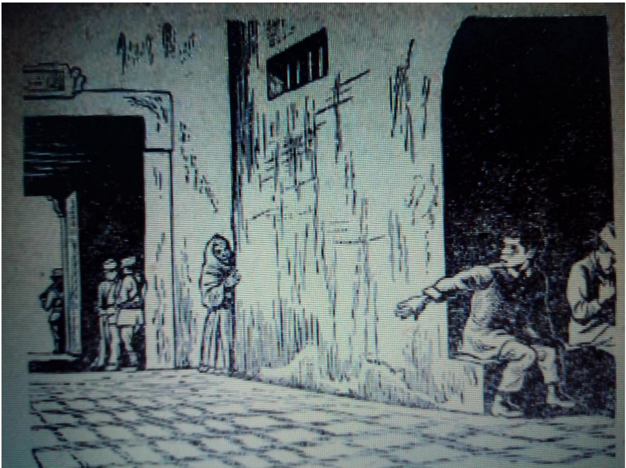
Ilustración 9. Inicio de su vida sexual

La siguiente imagen muestra el momento en que la mujer vieja, con la que inició su vida sexual, va a buscarlo, y él le hace una señal para que no se le acerque sino que espere a que vaya por ella, porque le daba vergüenza que sus compañeros vieran con quién mantenía relaciones. También se observa una distribución armónica de las figuras geométricas, rectangulares y en cuadros, en el piso, puertas y ventanas. En la composición se presentan de nuevo los espacios y las distancias, marcando distintos planos: adelante, en medio y al fondo, muestra lo lejos y lo cerca, marca así la distancia entre él y la mujer.