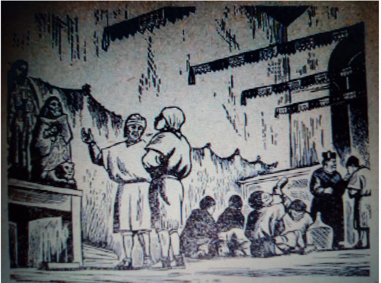
Ilustración 19. Aprendiendo sobre los santos

En la imagen anterior se muestra el momento cuando el protagonista aprende todo lo relacionado a los santos y los favores o milagros que realizan cada uno. Se observa que en la imagen predomina la luz, y el negro se utiliza no para dar sombra sino para remarcar que hay colores, como en las banderillas colgantes de la pared, las cuales se suelen ver cuando hay festejo o celebración.