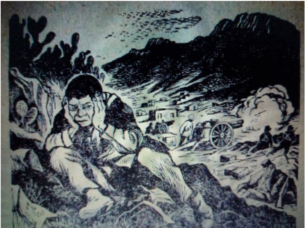
Ilustración 8. En medio de la lucha armada

militares y una vez que les dieron armas también les empezaron a pagar, un peso diario, hasta el momento el protagonista no había ganado tanto, a lo sumo pudo ganar de tres a cuatro pesos en la semana, no un peso al día, éste es un elemento que será de importancia después.