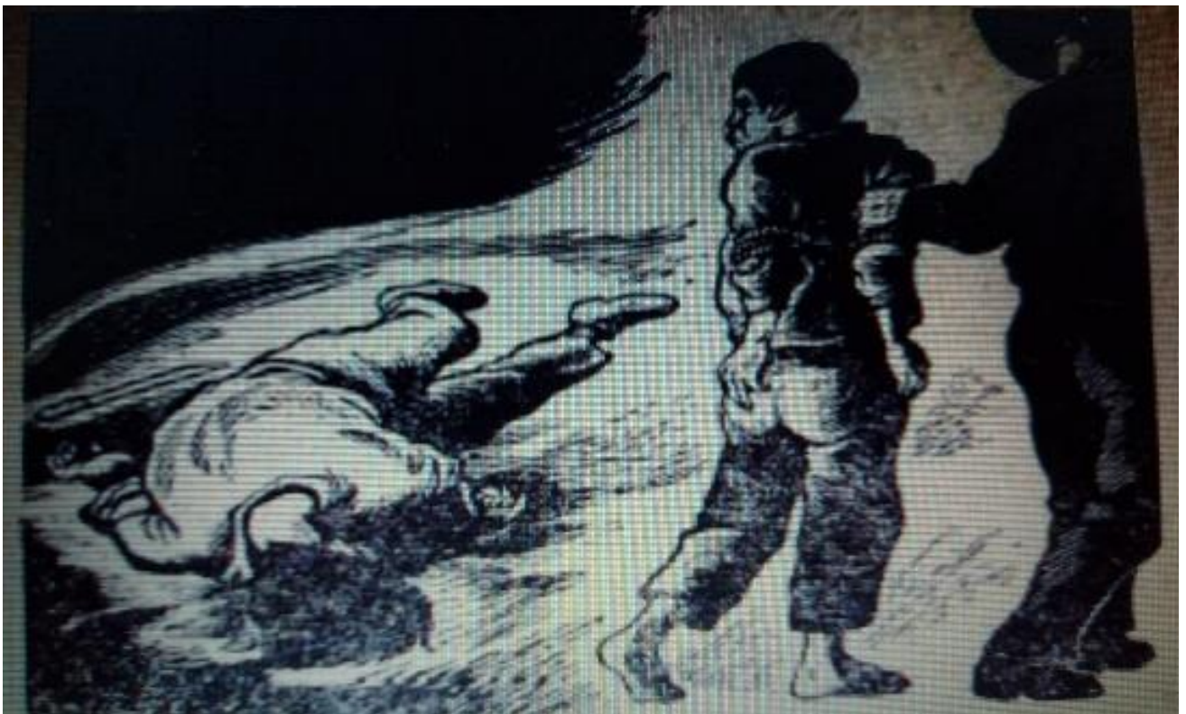
Ilustración 7. Su crimen fue no denunciar

La siguiente imagen representa ese momento, la luz en el cuadro está en el suelo mientras que el exterior es sombrío, a diferencia de las ilustraciones anteriores en los que se podía observar el paisaje y lo que sucedía alrededor. Tampoco puede verse la parte frontal de las personas, sólo las espaldas, como dando la espalda a la justicia, ocultando lo que en realidad pasó.