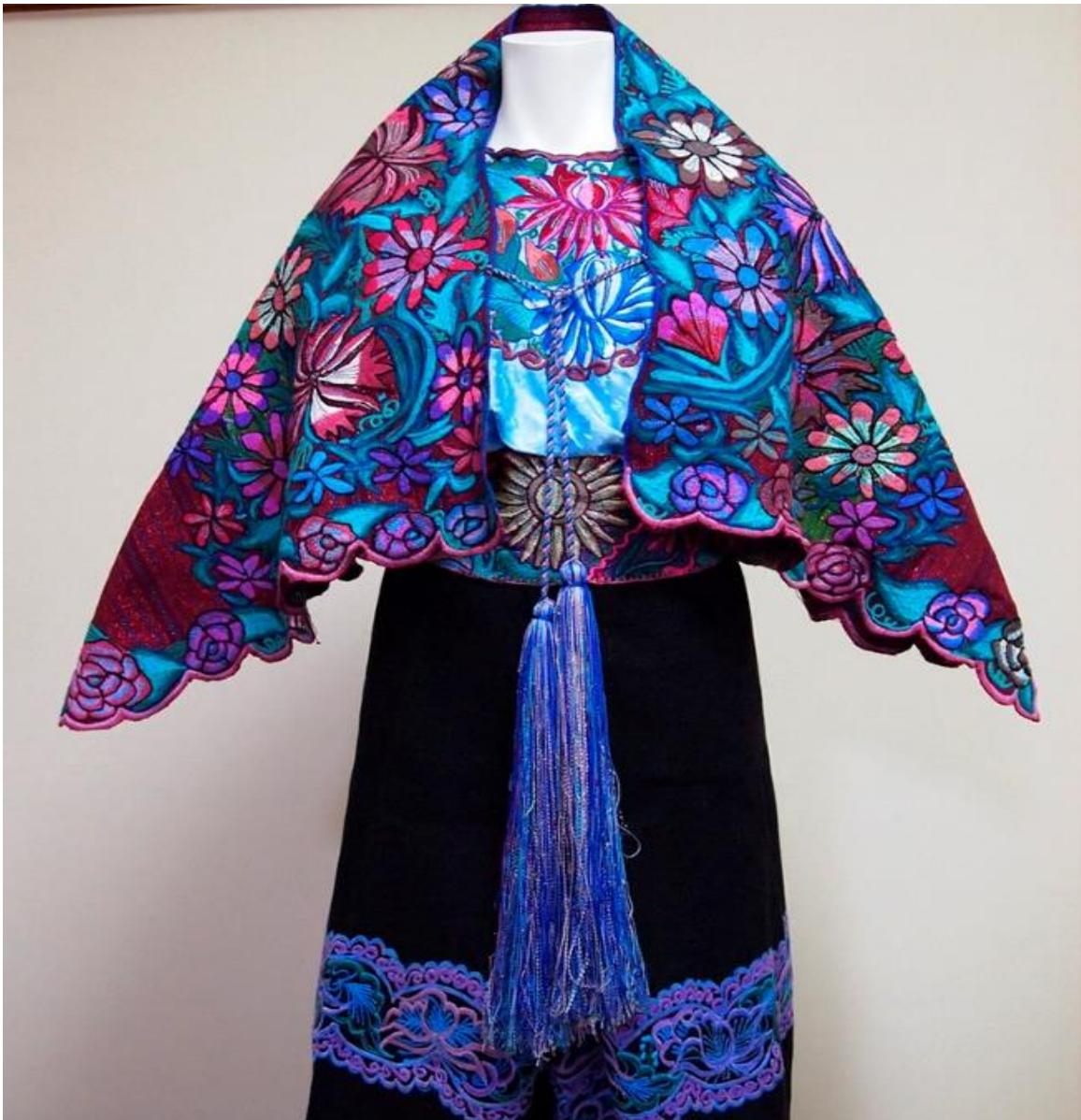
Ilustración 2. Traje típico femenino de Zinacantán

y Chamula, si bien son dos municipios colindantes de habla tsotsil, culturalmente son distintos o hasta rivales, pues no se consideran iguales, incluso la vestimenta es diferente, en Zinacantán (lugar que en náhuatl significa “lugar de murciélagos”) los trajes, tanto de mujeres y hombres son tejidos en telar de cintura y luego bordados por estampados, en su mayoría de flores, el rebozo bordado que usan las mujeres sobre los hombros asemejan alas de murciélagos, como se observa en la siguiente imagen.