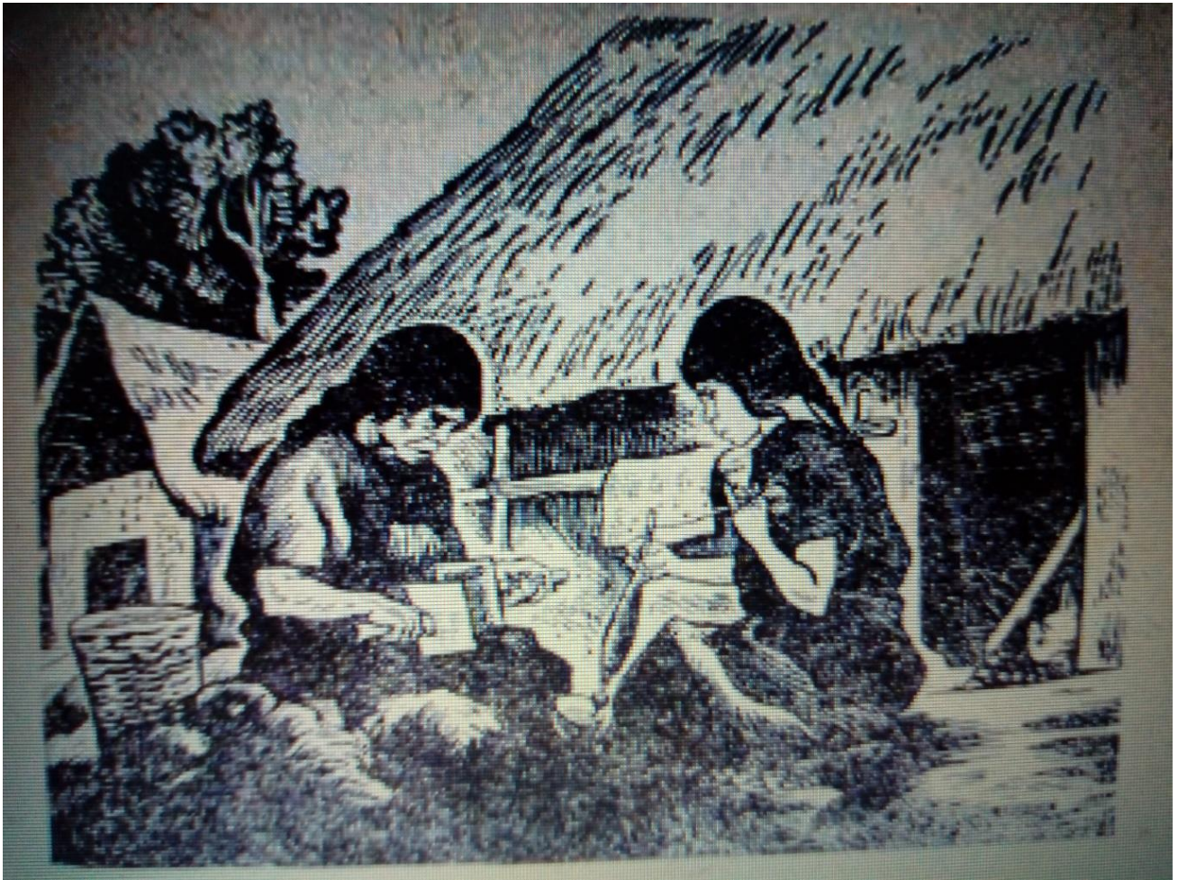
Ilustración 14. Mujeres trabajando

Por otra parte, si bien el protagonista comparte una identidad colectiva, la cual se mantiene inmutable durante mucho tiempo y se transforma sólo debido a elementos externos, los cambios en la identidad individual, aunque son graduales, están en continua transformación; esto debido a que, según Larrain y Hurtado (2003), las identidades individuales tienen contenidos psicológicos, algo que no ocurre en las identidades colectivas, estas últimas agrupan distintos discursos identitarios, o diversas identidades individuales.