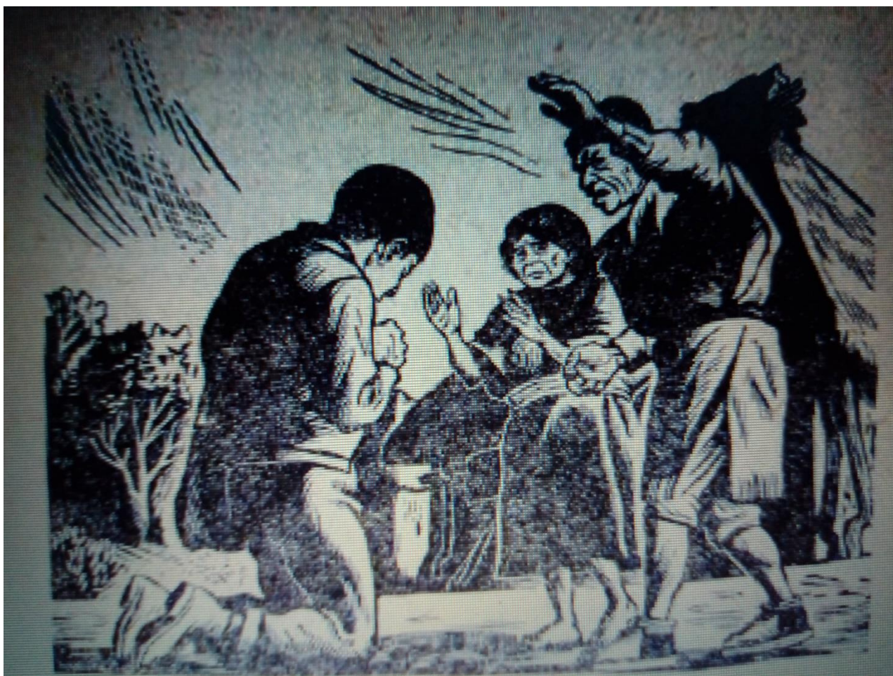
Ilustración 10. Juan Pérez Jolote regresa a su casa

un adulto. Es necesario recordar que la otredad o la alteridad, a nivel individual son indispensables en la configuración de la identidad, ““porque la identidad sólo puede construirse en la interacción simbólica con los otros” (Larrain, 2003: 31), y en la relación con los otros lo que se busca es el reconocimiento hacia uno mismo.