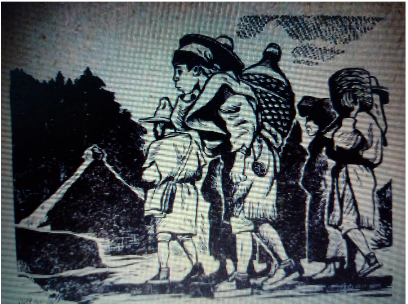
Ilustración 12. Dotes para el matrimonio

En la siguiente imagen se observa este momento, cuando él y su familia llevan los dotes a casa de sus suegros. La luz predomina en su indumentaria, la cual describe como limpia y nueva.