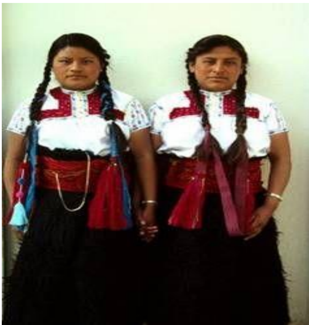
Ilustración 3. Vestimenta tradicional femenina de Chamula

En cambio, en Chamula, los trajes son de lana de borrego o carnero, en las faldas y chamarros, en mujeres y hombres respectivamente. Este animal es el más valioso en la economía del pueblo “porque de él se obtiene el vellón para hacer las prendas de vestir de la mujer, el chamarro para el hombre, la ropa de cama y otras prendas que se destinan al comercio con los pueblos indios vecinos” (Pozas, 2012: 210). La indumentaria cambia en los días de fiesta, los hombres usan un chamarro