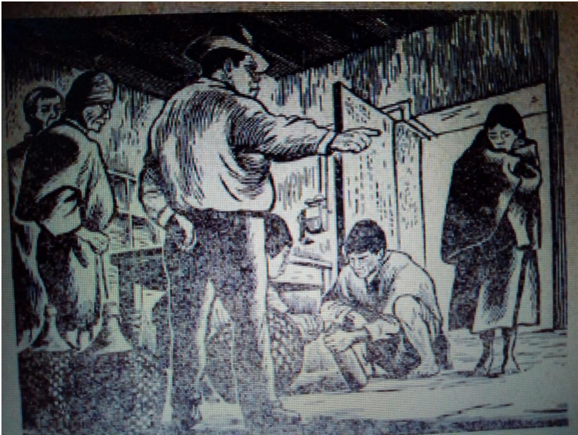
Ilustración 16. Sirviendo al secretario

En esta etapa de su vida, el protagonista tiene en claro sus objetivos, no como antes que sólo vivía conforme se le iban presentando los sucesos, sin quejarse, sin saber a dónde lo llevaban cuando era niño, sin defenderse ni alegar a su favor como cuando lo incriminaron y lo llevaron preso, sin cuestionar los motivos de la guerra; en cambio ahora, sabe lo que quiere a partir de lo que observa en su comunidad.