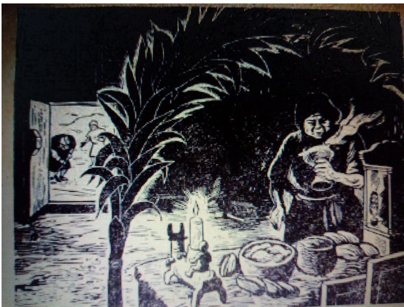
Ilustración 11. Ritual de las ánimas

Si nuestra madre Chulmetic , no hubiera llorado, todos los hombres y mujeres que mueren volverían al tercer día después de muertos. Por eso todos los días va Chultotic al Olontic a ver a su padre y a los que han muerto cada día y que ya no volverán; sólo sus ánimas salen hoy a visitar a sus parientes (Pozas, 1959: 58).