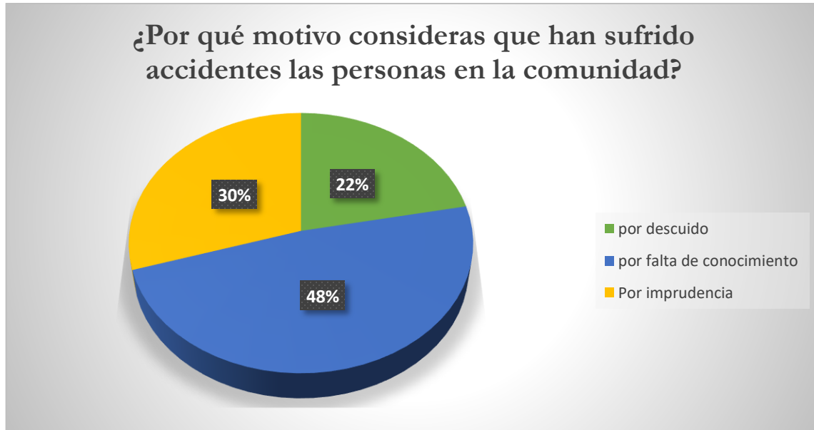
Grafica 3 ¿Por qué motivo consideras que han sufrido accidentes las personas en la comunidad?

Otro punto importante a considerar como acto inseguro debido a que las personas no toman en cuenta precauciones que se deben tomar para evitar sufrir accidentes e incidentes, teniendo como dato: