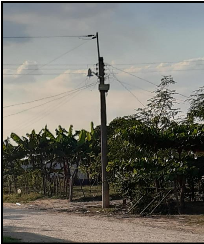
Figura 10 transformadores de luz

De otra manera existe un solo transformador que proporciona la energía eléctrica en la colonia nuevo cactus 43, Reforma Chiapas considerando que los 18 postes de luz que se encuentra en cada uno de los sectores están recargados, el cual genera sobrecalentamiento y pueda ocasionar un corto circuito en toda la colonia debido al voltaje que existe además de que hay cables de alta tensión que pasan por arriba de sus casas y línea de cables ya que las instalaciones de vía acceso muspac PEMEX se encuentra en la misma zona y estos cables están cerca de las viviendas lo cual corren peligro ya que los cable de alta tensión que están en la colonia le pertenecen a la empresa para estatal PEMEX.