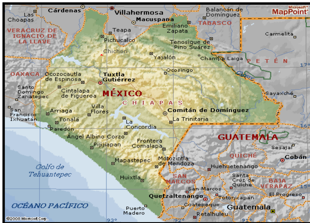
Figura 3. Mapa del Estado de Chiapas

Municipios y principales ciudades Se conforma de 124 municipios, mismos que se distribuyen en nueve regiones: Centro, Altos, Fronteriza, Frailesca, Norte, Selva, Sierra, Soconusco e Istmo-Costa. Sus principales ciudades son: Tuxtla Gutiérrez, San Cristóbal de Las Casas, Tapachula, Palenque, Comitán y Chiapas de Corzo.