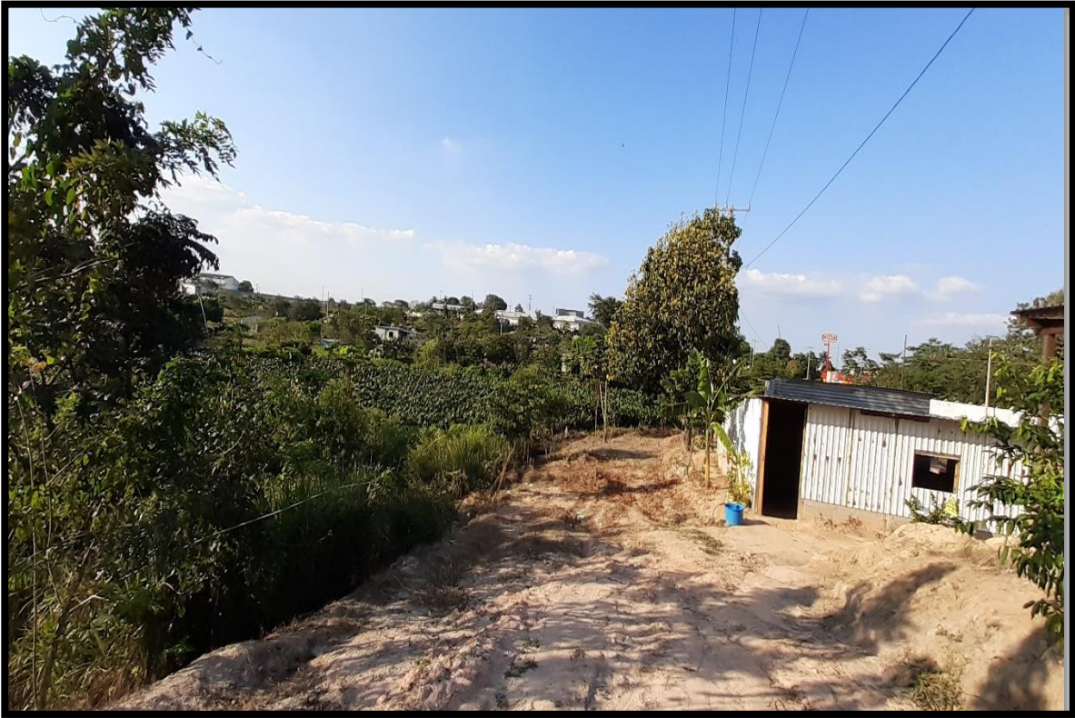
Figura 9 Pantanos de aguas negras

La zona urbana se encuentran a la orilla de dos pantanos de aguas negras en donde los mismo habitante tiran sus residuos como bolsa, plásticos, animales muerto, y alrededor de los pantanos hay ocho viviendas la cual puede ocasionar problemas de seguridad e higiene ya que esto genera malos olores a los habitantes en esta zona restringida, en tiempo de lluvias los pantanos crecen con el agua y esto acacia inundaciones a su hogares donde afecta las viviendas de los habitantes y esto es un peligro para los familiares ya que están expuesto a sufrir enfermedades infecciosas. Estos pantanos de aguas negras no cuentan con señalamiento de seguridad de tal manera que las personas en cualquier momento corren el riesgo de tropezarse y sufrir accidentes ya que su entorno de los dos pantanos se encuentra desnivelados