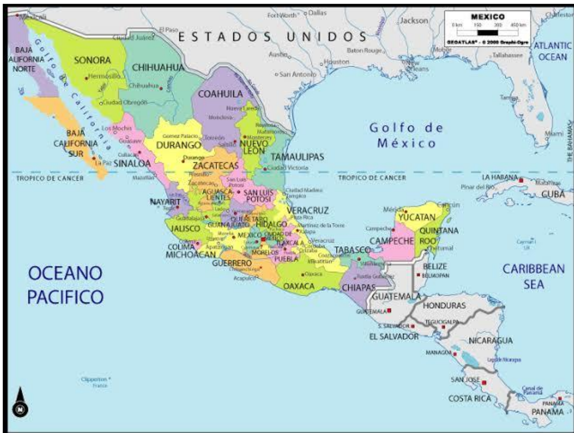
Figura 2. Mapa de la República Mexicana

Su superficie es 1.964.375 km 2 , siendo uno de los países más extensos de todo el planeta. El lenguaje oficial del país es el español, pero a su vez hay otras 67 lenguas indígenas que también se hablan según zona.