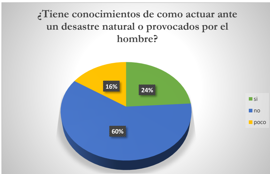
Grafica 1 ¿Tienes conocimientos de cómo actuar ante un desastre natural o provocados por el hombre?

Siendo así que se obtuvieron los siguientes resultados, sabiendo que un 60 por ciento de la población desconoce cómo actuar ante una situación adversa que les pudiera provocar las condiciones de peligro presentes dentro de la colonia.