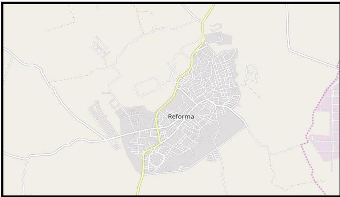
Figura 4 Mapa de Reforma Chiapas

El municipio de Reforma, Chiapas fue regido como pueblo y cabecera municipal el 12 de enero de 1883, por decreto promulgado por el gobernador de Chiapas, Miguel Ultrilla, la formación del pueblo que un principio llevo el nombre del santuario de la reforma cuenta con un número de habitantes de 40,711