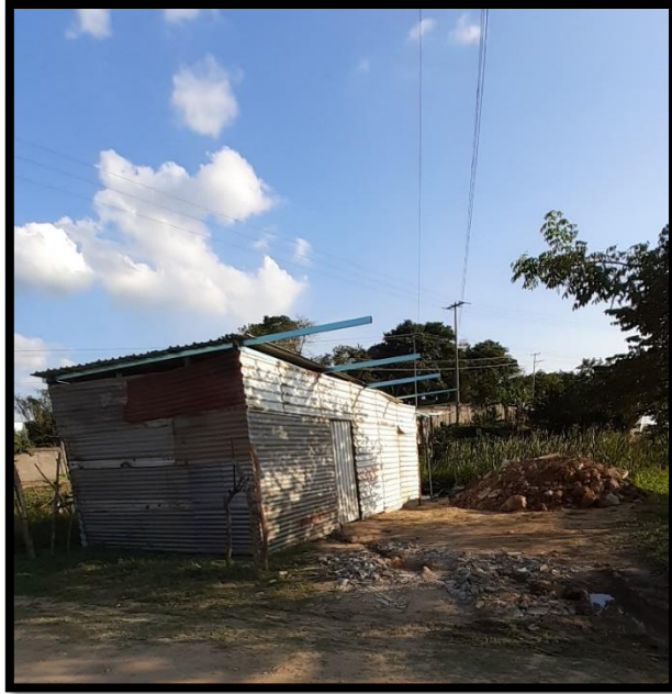
Figura 14 Viviendas en malas condiciones