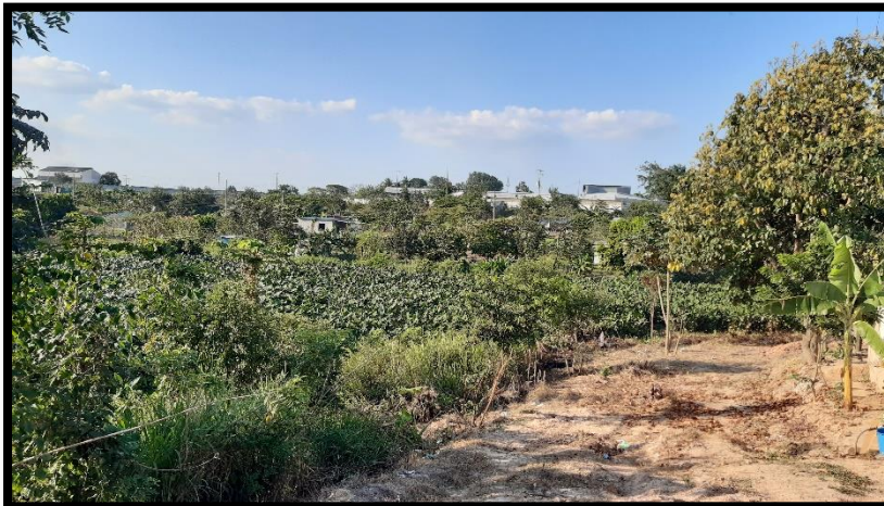
Figura 13 Pantano de aguas negras