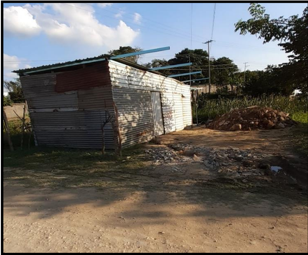
Figura 6 viviendas

Las viviendas en la colonia irregular están en malas condiciones para habitarlas ya que son de láminas y madera que hace tiempo ellos no utilizaban y con el paso del tiempo se pueden ir derrumbando, los habitantes no cuentan con un buen diseño de sus casas y las construcciones de sus hogares fueron diseñados por ellos mismo y solo en la colonia nuevo cactus 43 Reforma, Chiapas se encuentra 62 viviendas de material, mientras que 349 cuenta con viviendas humildes como se mencionó antes.