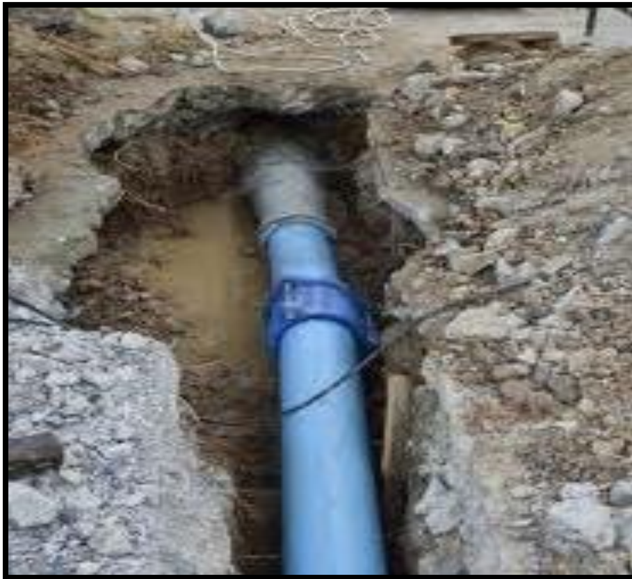
Figura 11 Regulador de agua

En la colonia irregular solo existe un regulador de agua que está en malas condiciones por falta de mantenimiento ya que a cada rato se rompe la bomba de agua, y genera fuga de agua y los habitantes de la colonia en varias ocasiones se les hace complicado componerlo y esto genera problemas de agua potable ya que por semanas no tenga agua y es el único regulador que proporciona el agua a toda la colonia. Los habitantes de la colonia nuevo cactus 43 Reforma Chiapas no cuentan con un drenaje por falta de inversión y cada vez que el regulador de agua se rompe se filtra el agua dentro de la misma tubería de agua ya que al momento de componerlo se les hace complicado poder componerlo y han optado por romper el suelo ya que el regulador se encuentra escarbada de bajo del suelo la cual no cuenta con señalamiento de seguridad y en cualquier momento puede ocasionar un accidente a las personas de la colonia.