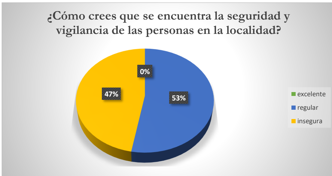
Grafica 2 ¿Cómo crees que se encuentra la seguridad y vigilancia de las personas en la localidad?

De acuerdo con el resultado obtenido al cuestionamiento, “¿Cómo crees que se encuentra la seguridad y vigilancia de las personas en la localidad?”. Se obtuvo lo siguiente: