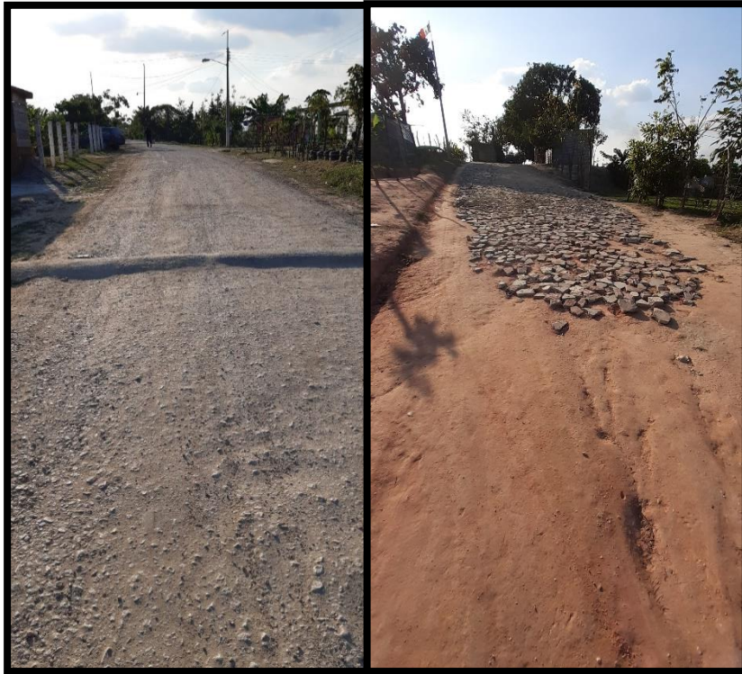
Figura 12 Calles no pavimentadas