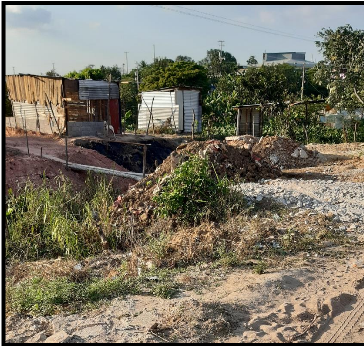
Figura 15 Vivienda a la orilla de pantanos de aguas negras