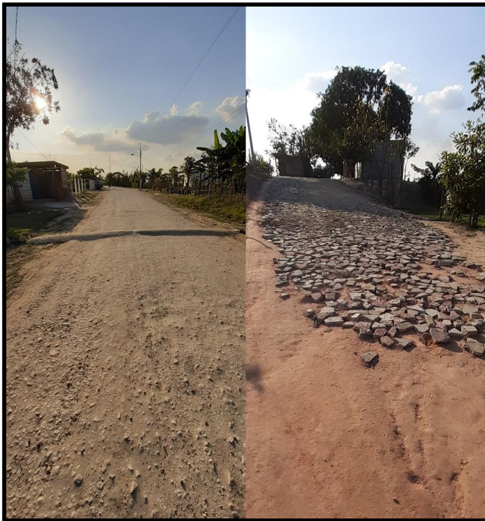
Figura 7 Calles

En la colonia nuevo cactus 43, Reforma Chiapas solo cuenta con 52 calles las cuales son calles no pavimentadas que se encuentran en pésimas condiciones por falta de señalamiento y topes, que al momento de entrar los vehículos a la colonia irregular se les dificulta la entrada y posiblemente sufrir las consecuencias de lesiones en su integridad física de las personas de dichas afectaciones. En tiempos de lluvias la falta de mantenimiento en las calles ha provocado inundaciones ya que sus niveles de agua incrementan rápidamente por la superficie plana en la que se encuentra y esto se vuelve un lodazal que se les hace complicado a los habitantes salir de sus hogares hacer sus cosas.