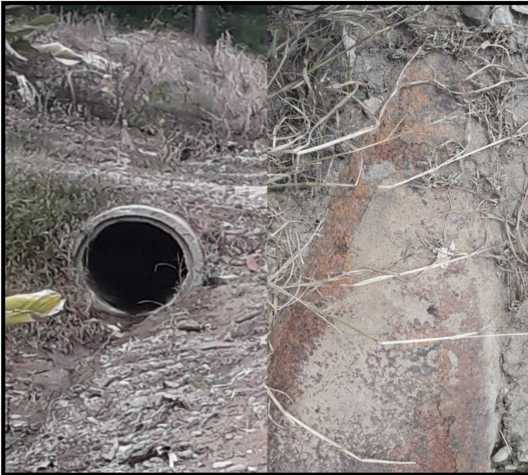
Figura 8 Tuberías de alta tensión

En esta colonia irregular se encuentra en un terreno prohibido que es propiedad de PEMEX, en esta zona restringida hay tuberías de alta tensión que pasan por debajo de sus casas y en cualquier momento puede ocasionar una explosión y fuertes fugas de gas por la ruptura de una línea de conducción que pasa por la empresa de vía acceso muspac PEMEX. Las tuberías que se encuentran en la colonia nuevo cactus 43, Reforma Chiapas que están en fusión y la cual se ven a plena vista han sido desenterradas por los mismos habitantes y que no tiene señalamiento estas tuberías son ductos de alta presión bajo tierra que le pertenecen a la empresa paraestatal PEMEX y que no pueden estar escarbadas porque son altamente peligrosas lo cual los habitantes corren un gran riesgos ya que es en una zona restringida.