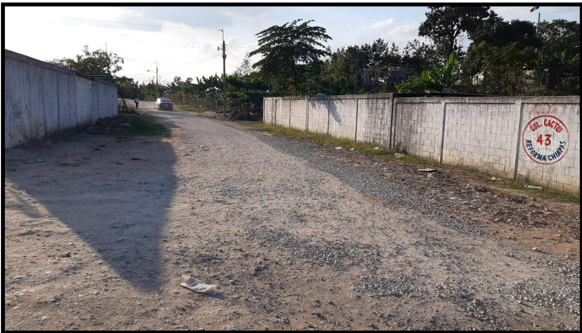
Figura 5. Colonia Nuevo Cactus 43, Reforma, Chiapas

La colonia solo cuenta con un vaso de regulador de agua donde no da abasto para los seis sectores.