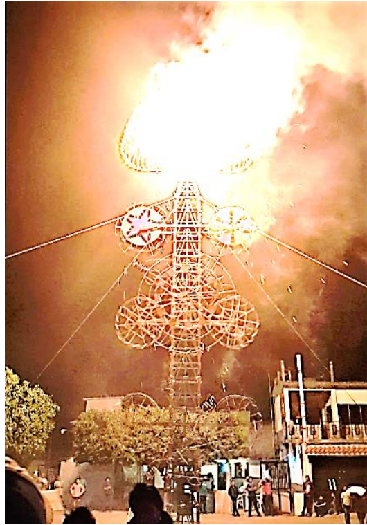
Figuras 27. Quema de castillo en el atreo de la iglesia de San Pablo Apóstol después de la toreada (Núñez, 2018).

junta de solteras puesto que ahí se lleva a cabo el llamado “baile de las solteras” en el cual un grupo o banda anima la noche con música variada y la junta brinda cena y aguas frescas a todos aquellos que asistan al baile al igual que la noche anterior (Alcazar, 2018).