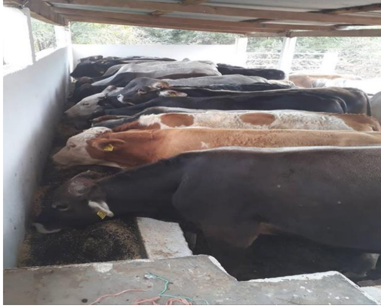
Figura 6. Exposición ganadera en el lienzo charro de Acala, Chiapas (Núñez 2018).