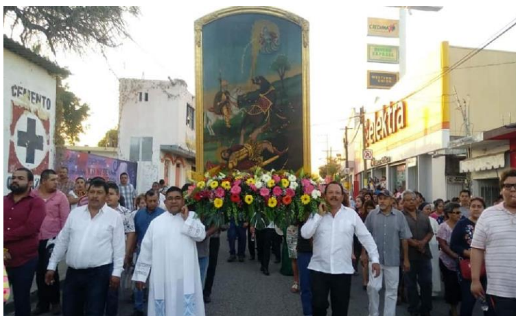
Figura 13. Presidente municipal y sacerdote del estado de Axochiapan, Morelos cargando la imagen de San Pablo Apóstol en el paseo en honor a la imagen (La unión de Morelos, 2008).

La festividades dan inicio con la procesión de “la cerita”, encabezada por los mayordomos y autoridades municipales. Posteriormente se lleva a cabo el corte del listón para dar paso a las actividades de la feria. Los festejos inician el día 20 de enero y continúan de manera permanente hasta el 28 de enero. Este año 2018 los visitantes de la fiesta pueden disfrutar de artistas de talla internacional como el cantante “El Fantasma” y del comediante Teo González, entre otros eventos sorpresas para la convivencia de las familias (morelos, 2018).