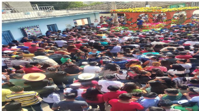
Figura 15. Personas participando en el paseo en honor a San Pablo Apóstol en Acala, Chiapas (Núñez, 2018).

El día grande se realiza un paseo en honor a San Pablo Apóstol en el cual los habitantes de la comunidad junto con banda de música, tambor, cohetes, juegos artificiales, cabalgata, parachicos, chiapanecas, figurones, panzudos y carros alegóricos dan realce y alegría a la festividad, días antes se llevan a cabo otras actividades como lo son los enramos, palo encebado entre otros. Dentro de la gastronomía de la festividad se destaca alimentos y bebidas típicas del municipio como el café, tamal, pozol, algunos platillos más elaborados como la chanfaina, el mole, la barbacoa y los dulces típicos.