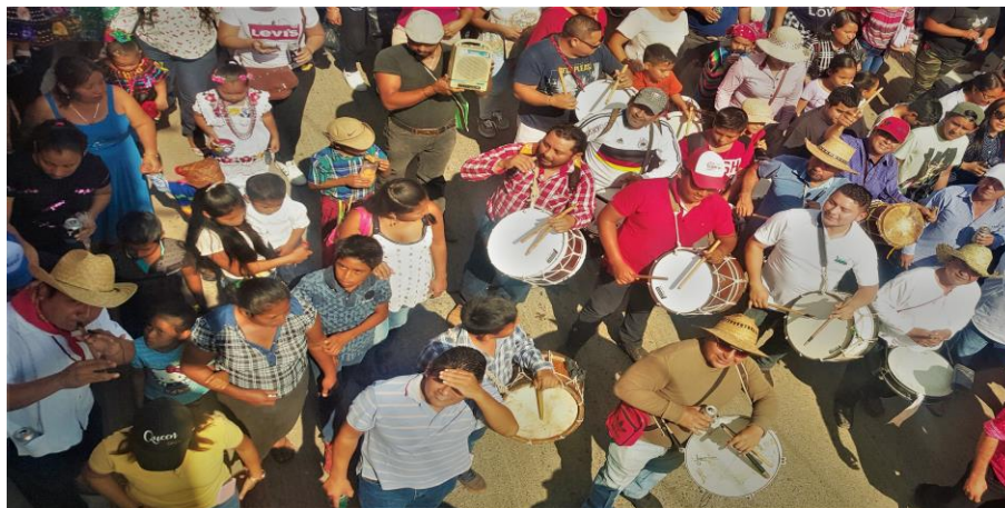
Figuras 30. Grupo de tambores “el rey de los cielos” (los carabola) tocando en el paseo en honor a San Pablo Apóstol (Núñez, 2018).

Durante el paseo los integrantes de las diferentes juntas van obsequiando agua a las agrupaciones participantes puesto que el recorrido es extenso y el calor tanto del sol como de las personas que se aglomeran es demasiado.