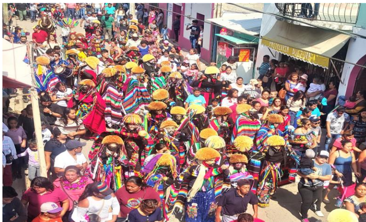
Figuras 29. Grupo de parachicos y chiapanecas en el tradicional paseo en honor a San Pablo Apóstol (Núñez, 2018).

Los integrantes de la comparsa llegan a la casa de don Javier y ahí comienzan a vestirse esperando la hora de partir hacia el atrio de la iglesia para comenzar junto a las demás comparsas y habitantes del pueblo el magno paseo en honor a San Pablo Apóstol.