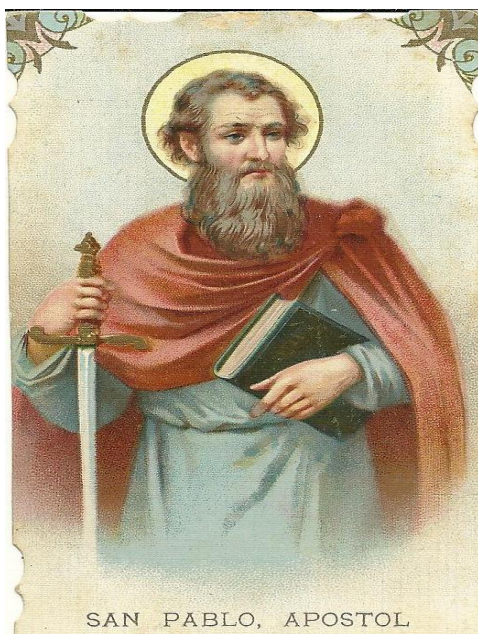
Figura 12. Estampa de San Pablo Apóstol (Illes Balears, 2002).

Tras una estancia en Damasco (donde, después de haber recuperado la vista, se puso en contacto con el pequeño núcleo de seguidores de la nueva religión), se retiró algunos meses al desierto (no se sabe exactamente adónde), haciendo así más firmes y profundos, en el silencio y la soledad, los cimientos de su creencia. Vuelto a Damasco, y violentamente atacado por los judíos fanáticos, en el año 39 hubo de abandonar clandestinamente la ciudad descolgándose en un gran cesto desde lo alto de sus murallas (Biografías y Vidas, 2017).