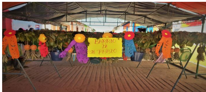
Figura 22. Enrramos terminando a la espera de la junta grande para ser transportados a la iglesia de San Pablo Apóstol (Núñez ,2018).

Cuando esto sucede la junta en compañía de algunas personas cargan los enrramos y comienza el recorrido hacia la iglesia por las calles del municipio con música de viento, disfrazados, parachicos, chiapanecas y chuntaes.