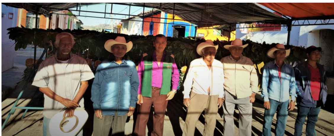
Figura 19. Enrramadores del barrio San Pablo (Núñez, 2018).

Para la confección de los enramos cada barrio cuenta con su grupo de enrramadores, y al igual que las diferentes juntas de la feria, este grupo de enrramadores también cuenta con un presidente, tesorero y secretario, pues los habitantes del barrio no solo brindan apoyo físico para la realización de los enramos sino algunos dan diferentes donativos como económicos, frutas y trastes de plástico. (Fonseca, 2018)