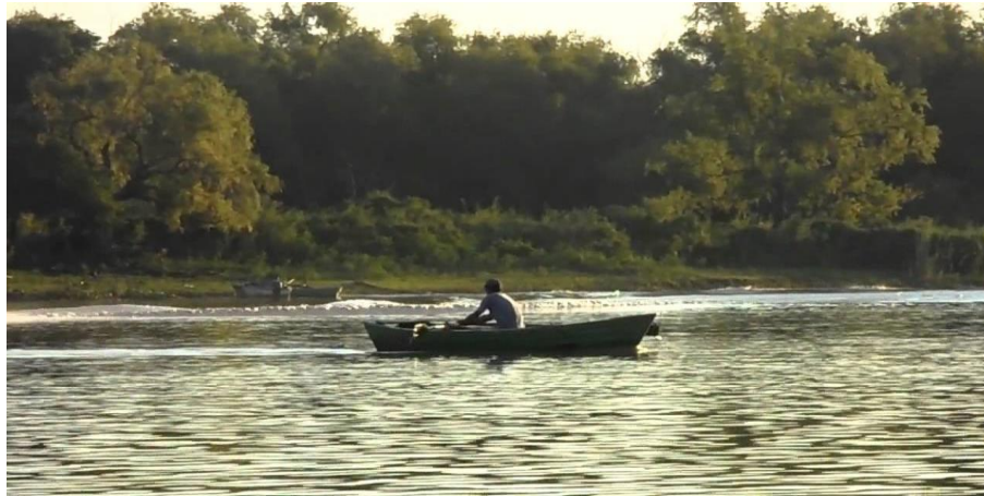
Figura 4. Habitante del municipio cruzando el rio Grijalva en su canoa desarrollando la actividad de pesca (Núñez, 2018).

ahora por otro lado existen otras centros de recreación para pasar esos días calurosos como los diferentes restaurantes con alberca dentro de los que destacan “la Rocallosa”, “el Charolas” y “la Quinta Candelaria”.