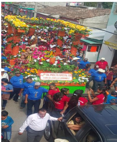
Figuras 28. Tradicional paseo en honor a San Pablo Apóstol (Núñez, 2018).

Después de esto el pueblo se reúne en el atrio de la iglesia para esperar a que los elementos de la junta grande bajen a la imagen de San Pablo Apóstol de su nicho para colocarla en el carro alegórico principal del recorrido.