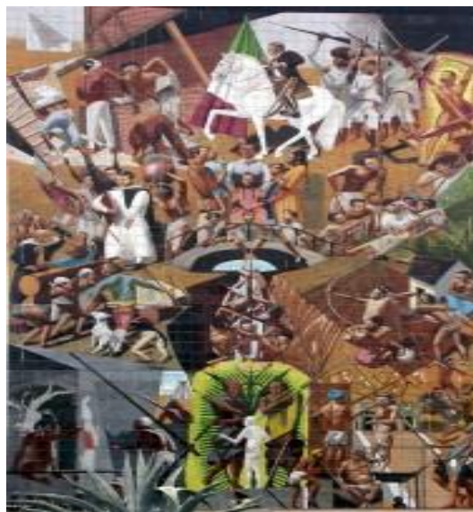
Figura 9. Mural titulado “ Visión plástica de la historia chiapaneca ” (Cesar Corzo, 1993).

A su llegada se encuentran con asentamientos zoques ya deshabitados, pero el Berlín muy seguramente seguiría habitado por los zoques, mismos que serían dominados y desplazados por los recién llegados (Xicotencalt, 2018).