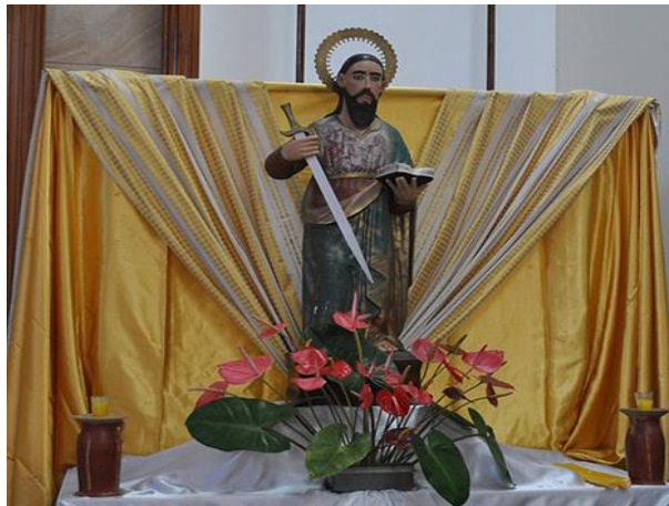
Figura 14. Imagen de San Pablo Apóstol en el templo con el mismo nombre en Honduras (La tribuna Hondureña, 2018).

Al medio día repique de campanas con música de banda, a las 5:00 de la tarde el desarrollo del Santo Rosario y Novena, a las 6:00 de la tarde la celebración de la Santa Eucaristía, 7:00 de la noche la procesión con el patrón San Pablo, a las 8:00 de la noche la animación y música de banda y a las 9:00 de la noche el show de luces y quema del toro fuego, de esta manera concluyen las actividades con respecto a la feria y así sucesivamente cada año (La tribuna Hondureña, 2018)