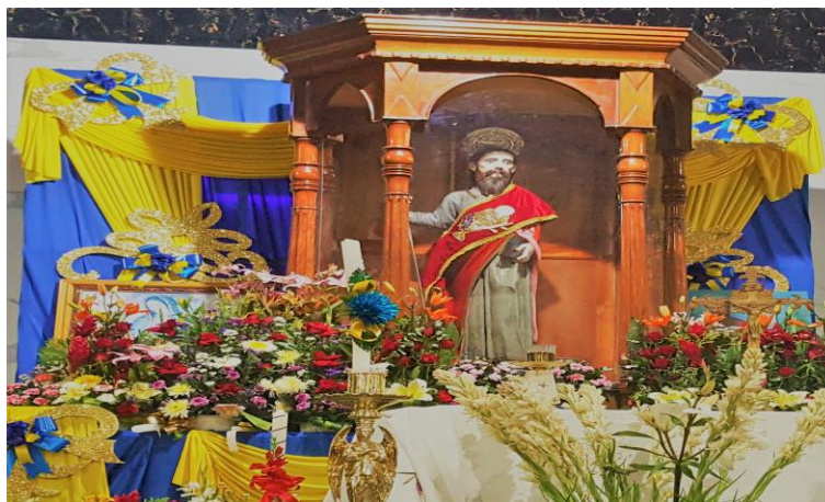
Figura 11. Imagen de San Pablo Apóstol (Núñez, 2018).

Adquirió así una sólida formación teológica, filosófica, jurídica, mercantil y lingüística (hablaba griego, latín, hebreo y arameo), en concordancia con la educación que había recibido, presidida por la más rígida observancia de las tradiciones farisaicas, Saulo se significó por aquellos años como acérrimo perseguidor del cristianismo, considerado entonces una secta herética del judaísmo.