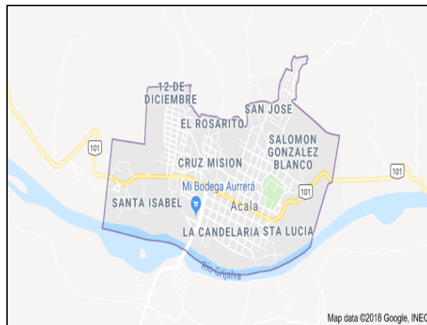
Figura 7. Mapa ubicación de los barrios del municipio de Acala (INEGI, 2018).

Acala se divide en barrios los cuales corresponden a un santo en específico y son: San José, San Pedro, 12 de Diciembre (Virgen de Guadalupe), Cruz Misión, Santa Lucía, Santa Isabel, Santa Cecilia, Virgen de Candelaria y San Pablo.