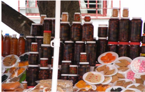
Figura 32. Jocotes y nances curtidos presentados a la venta al público general (Núñez, 2018).

mucha influencia del Istmo, por su sabor aroma y texturas, donde podremos encontrar platillos tradicionales de otros estados como las tlayudas, pollo juchi, y de la misma manera encontramos los típicos dulces típicos como el jocote y nance curtido.