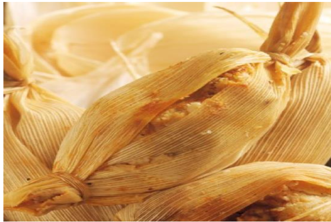
Figura 35. Tamales de bola (Núñez, 2018).

Para concluir estas actividades llega el momento de degustar este delicioso producto, se disfruta en compañía de un buen café de olla o un atol que de igual manera se obsequia en el atreo de la parroquia.