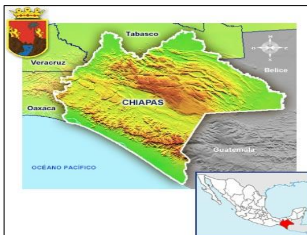
Figura 1. Mapa ubicación geográfica de Chiapas (INEGI, 2013).

Según datos obtenidos de la base de datos del Instituto Nacional de Estadística y Geografía (INEGI, 2013). Chiapas representa 3.8% del territorio nacional, que lo ubica en el lugar 10 del país. El estado colinda al Norte con Tabasco; al Este con Belice; al Sur con el Océano Pacífico y la República de Guatemala; al Oeste con Oaxaca, Veracruz de Ignacio de la Llave y Océano Pacífico.