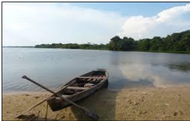
Figura 16. Canoa a la orilla del río mostrando paisaje del mismo (Núñez, 2018).

Actualmente las canoas solamente son utilizadas como atracción turística para acceder a diferentes zonas del Río Grijalva en las cuales se puede nadar y desarrollar convivios o simplemente para refrescarse ya que el municipio cuenta con un clima muy caluroso la mayor parte del año y por lo tanto ir al río o a las albercas son de las actividades más comunes para los pobladores y visitantes del lugar.