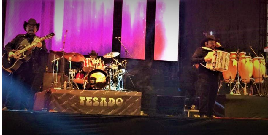
Figuras 31. Grupo pesado presentándose en el estadio municipal de Acala, Chiapas en el marco de las festividades de San Pablo Apóstol (Núñez, 2018).