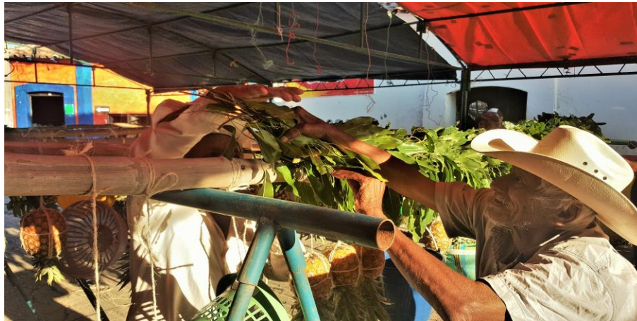
Figura 21. Enrramadores colocando la hoja de tempisque (Núñez, 2018).

Para la hechura de los enrramos se utilizan elementos primordiales como son: una base en la cual se dejan reposar los “otates” (varas de bambú) de una medida aproximada de 3.5 metros en los cuales se amarran los trastes o las frutas con un hilo de cáñamo para después forrarlos con hojas de un árbol llamado tempisque y como decoración final colocarles detalles hechos de papel china o papel crepe.