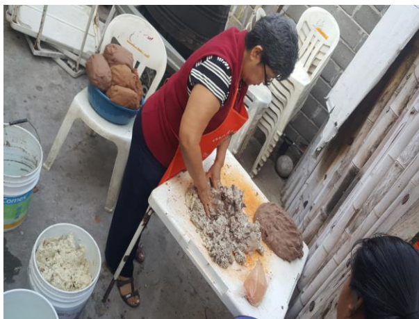
Figura 20. Esposa de enrramador preparando masa para pozol (Núñez, 2018).

Aparte de obsequiarles masa de pozol a los que donaron dinero y otras cosas para la hechura de los enrramos también se les regala la bebida ya preparada a todos los que participan en la elaboración de los enrramos así también a los visitantes que llegan a recoger las ofrendas mientras llega el momento de partir hacia la iglesia (Padilla, 2018).