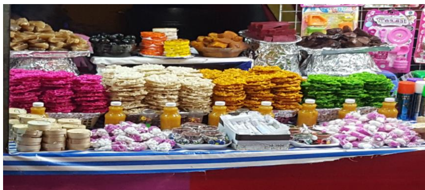
Figura 33. Dulces típicos de la festividad (Núñez, 2018).

Así es como el aguardiente se convierte en mistela que es una bebida alcohólica pero con sabor dulce gracias al piloncillo o panela, dentro de los dulces típicos de la fiesta podemos degustar de cocadas, dulce de camote, dulce de piloncillo, dulces de temperante etc.