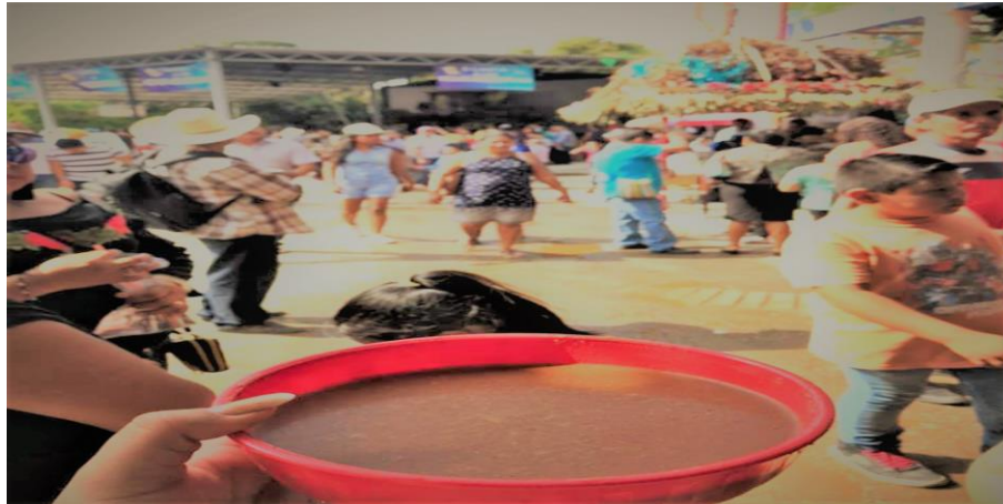
Figura 10. Personas disfrutando de pozol de cacao en el atreo de la iglesia de San Pablo Apóstol (Núñez, 2018).

Así como llegan personas a donar alimentos y bebidas también podemos encontrar comida de venta y para los visitantes como tamales de bola, de chipilín, de hoja de milpa o de salsa verde y bebidas como pozol, atol o café en las noches.