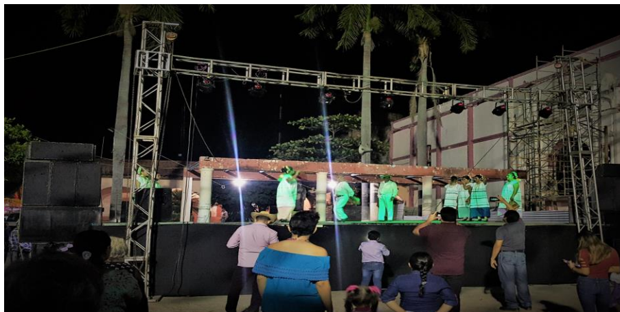
Figura 24. Grupo de danza folclórica deleitando a los visitantes de la parroquia de San Pablo Apóstol en el atrejo de la misma (Núñez, 2018).

conforman este grupo realizan toreadas, rifas y quermeses durante el año para de esta manera recaudar fondos y así poder brindar a los visitantes una bonita fiesta en honor a San Pablo Apóstol (Dominguez, 2018).