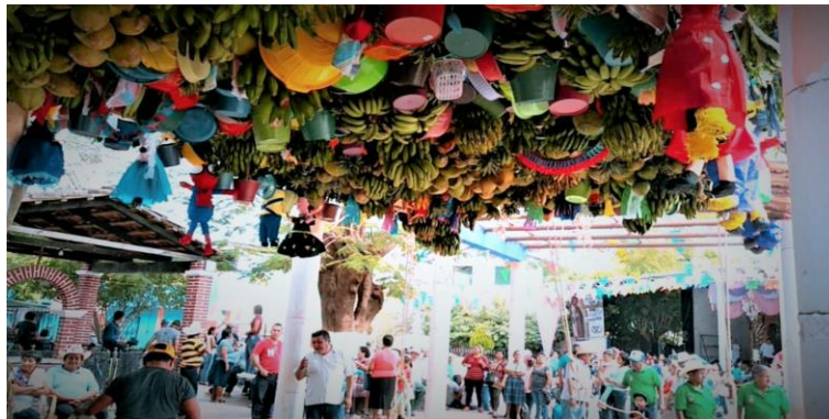
Figura 23. Enramos exhibidos en el atreo de la parroquia de San Pablo Apóstol (Núñez, 2018).

Y es así como cada barrio va dejando sus enramos en el atreo de la iglesia, a esta actividad se le conoce como “acarreo de enramos” y comienza a partir de las 10 de la mañana y puede terminar hasta a las 4 o 5 de la tarde.