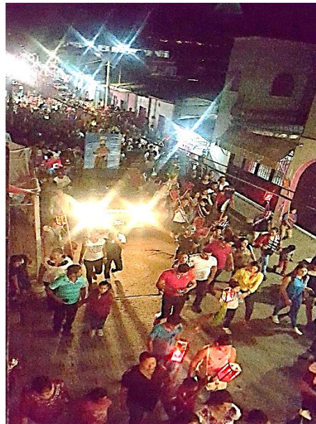
Figura 18. Tradicional anuncio de feria de San Pablo Apóstol (Núñez, 2018).

Es importante mencionar que dentro de este recorrido, el anuncio se detiene por momentos en determinadas esquinas con la finalidad de realizar una viva la cual es dirigida por una persona adulta integrante de la junta grande y designada por la misma para hacer la viva, diciendo las siguientes frases: “¡están listos señores!” a lo que la concurrencia responde “¡sí!” , entonces el portavoz grita con emoción y alegría “¡vivan las fiestas patronales por muchos años señores!” Contestando todos los presentes a una sola voz “¡vivan!” Inmediatamente la banda de música tocan la diana y la gente baila una coreografía libre seguidamente se escuchan los cohetes en el aire y se continua el recorrido de esta manera hasta llegar a la parroquia de San Pablo Apóstol.