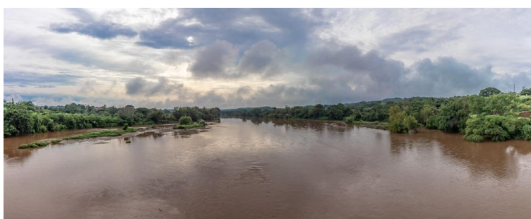
Figura 5. Caudaloso rio Grijalva después de fuertes lluvias en el municipio de Acala, Chiapas (Núñez, 2018).

Esta última siendo una fruta de sabor extraño ya que los habitantes del municipio dicen que pueden percibir distintos sabores al momento de degustar dicho fruto, entre ellos muchos dicen que tiene aroma a cítricos pero textura de guanábana ya que en interior de la fruta es en gajos pequeños y tiene un sabor algo parecido al mango o algunos dicen que incluso sabe a melón, muchos pobladores la usan para hacer agua fresca o incluso bolis ya que fría es una fruta que se disfruta mejor.