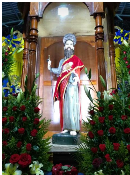
Figura 17. Imagen de San Pablo Apóstol (Núñez, 2018).

vio asombrado que efectivamente aquel personaje alto y barbado que apareció en su sueño era San Pablo, fue así como por petición de la imagen la presa fue construida en la Angostura, que es un lugar alejado del poblado y nuevamente San Pablo dejó en claro porque es considerado patrono del pueblo ya que está pendiente del cuidado de sus habitantes.