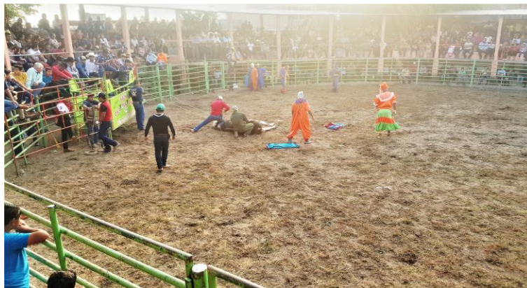
Figuras 26. Toreada en honor San Pablo Apóstol el día 24 de enero (Núñez, 2018).

En estos eventos se escucha música de viento en vivo y aparecen los llamados “panzudos” (personajes mencionados anteriormente) pero en esta ocasión cumplen la función de payasitos de rodeo y son los encargados de cuidar la seguridad de los jinetes durante el evento y animar las montas (Pèrez, 2018).