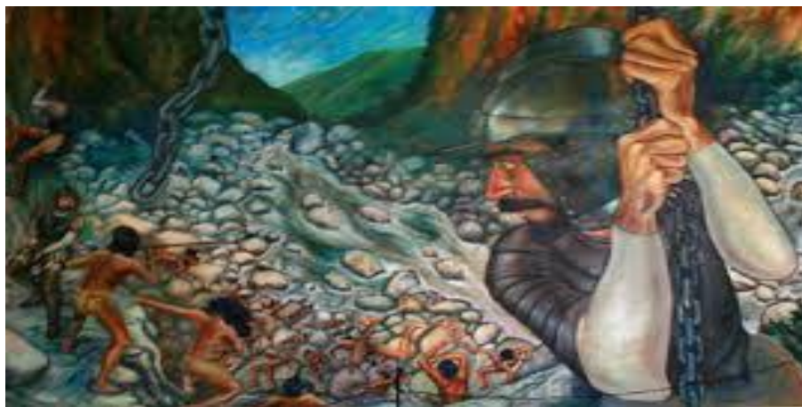
Figura 8. Imagen pictórica de la batalla del cañón del sumidero entre los indios chiapa y los españoles conquistadores (Museo Regional de Chiapas, 1997).

Hoy, debajo del incandescente sol de la región, sobrevive la única construcción perteneciente a la cultura Chiapaneca en el estado, una de forma piramidal con base cuadrangular, la cual habría sido utilizada como centro comercial, ceremonial y habitacional. El espacio que habría sido un sitio ceremonial originalmente, tendría 12 hectáreas de extensión, con forma de media luna desde una vista aérea (Xicotencalt, 2018).