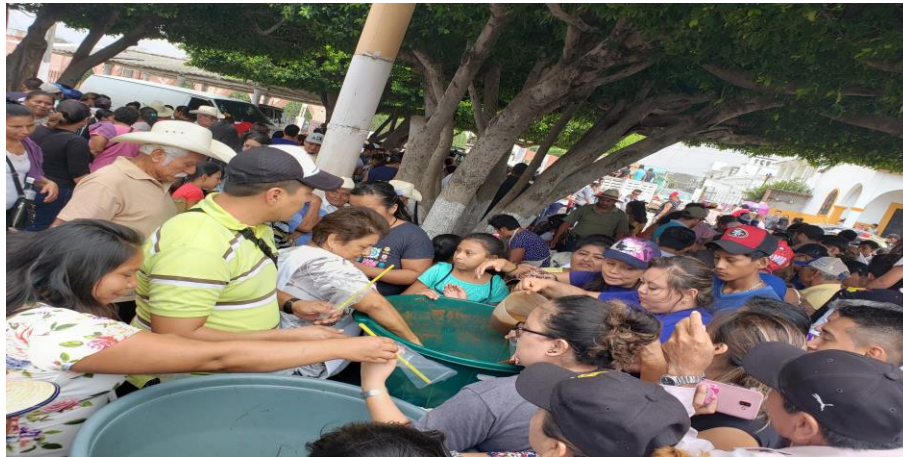
Figuras 25. Donación de pozol de diferentes familias a los visitantes de la parroquia (Núñez, 2018).

naturales como jamaica, horchata, limón, naranja en $15, o también refrescos embotellados al mismo precio.