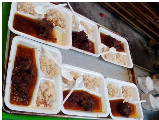
Figura 34. Barbacoa y arroz servido para los enramadores o padrinos de la fiesta (Núñez, 2018).

Actualmente todo eso ha cambiado ya que hoy en día es más común utilizar platos y vasos desechables ya que en palabras de los donadores resulta más económico dar los alimentos de esta manera que como se hacía anteriormente puesto que algunos visitantes se llevaban los platos o en ocasiones terminaban quebrándolos de ahí la razón por la cual actualmente se recurre a la utilización de desechables para mayor comodidad tanto de los donadores como de las personas que llegan a la iglesia.