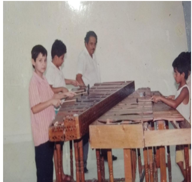
Reconocimiento por el 5to. Concurso Estatal de Marimba 1988.