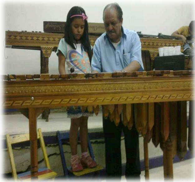
Agrupación de marimba de la Casa de la Cultura Simojovel en la final del Concurso Estatal de Marimba 2003.

Clases de marimba impartidas en la Casa de la Cultura Simojovel.