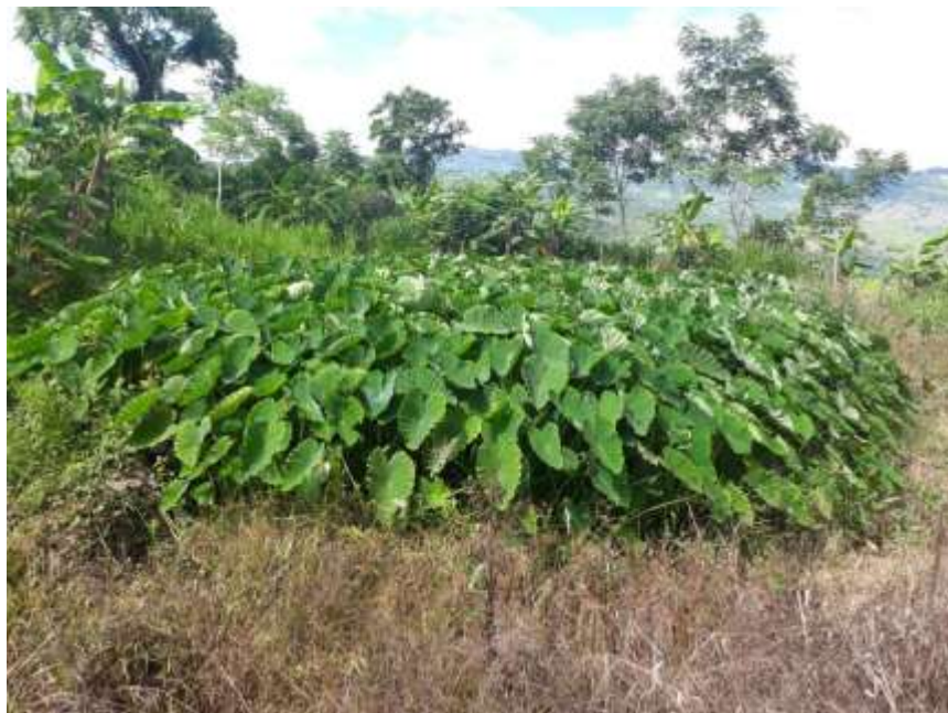
Figura 12. Zona de cultivo.

La malanga puede producirse ya sea por el cormo principal, por la plantación de los cormelos completos o por hijuelos que consisten en la porción superior de un cormelo 1 cm, más 20-25 cm pecíolo. El periodo normal de plantación de la malanga es a comienzo de la estación del clima lluvioso; sin embargo, si se dispone del riego apropiado puede producirse todo el año (Montalvo, 1991).