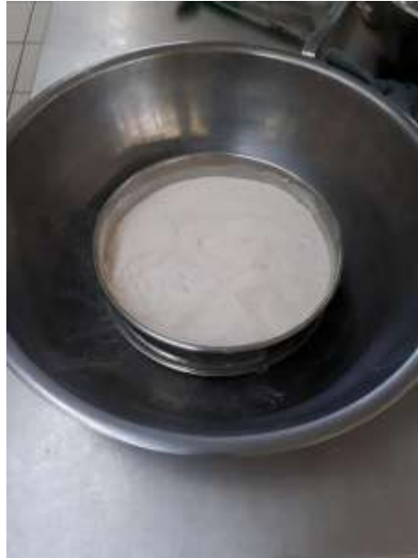
Figura 23. Proceso de colación para polvo de malanga.

La malanga se limpió para ser posteriormente llevado al horno de secado, donde se deshidrato por un periodo de 5 horas y se trituro para obtener harina del tubérculo mencionado, se guardó en bolsas ziploc durante al menos 4 meses en un lugar fresco y seco.