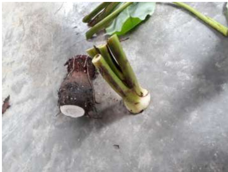
Figura 7. Partes de la malanga.

El desarrollo de una planta de tubérculos llegan a producir las ya mencionadas yemas que pueden producir una nueva planta; es decir al plantar el taro con una yema, se consigue desarrollar una planta a partir de esta, eso debe a que la planta está en crecimiento se alimentan del tubérculo donde se originó hasta que consumen los nutrientes y lo descomponen, a medida que crece la planta desarrolla más raíces y a su vez originan más tubérculos (SL, 1999-2017).