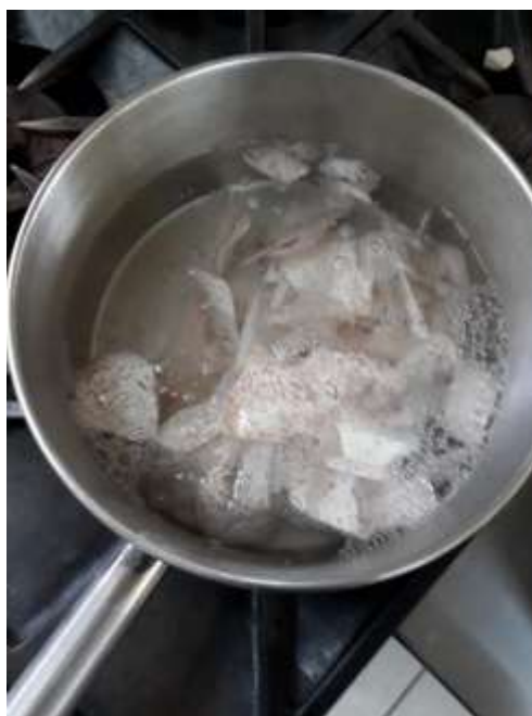
Figura 19. Proceso de malanga escalfada.

Para los efectos de la investigación se utilizaron los métodos de escalfado y deshidratación preliminares a la elaboración del polvo para harina de malanga que se empleó para la realización de los postres.