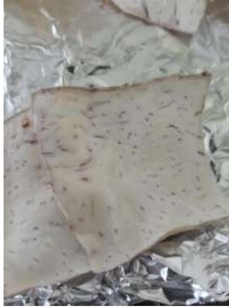
Figura 21. Malanga deshidratada.

Al tener la malanga deshidratada, se introduce en una licuadora a alta velocidad para triturarla hasta un tamaño de partícula fina, para posteriormente poder ser tamizada.