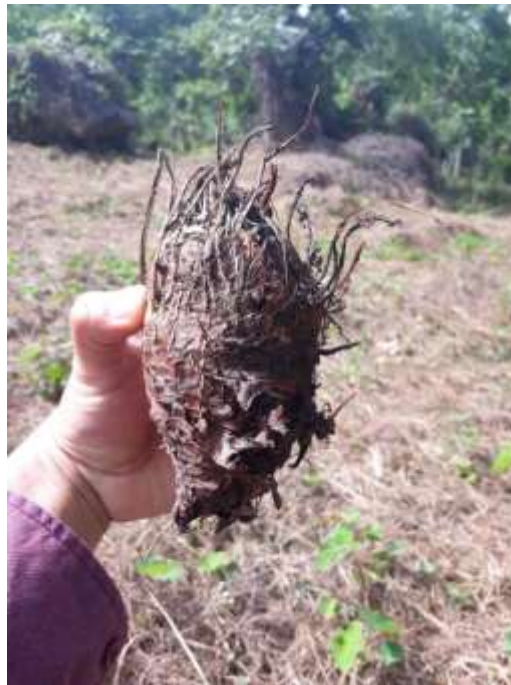
Figura 8. Vista del cormo de la malanga.

El cormo se divide en la zona cortical y el cilindro central. Es angosta de una apariencia compacta, está formada por parénquima de células isodiamétricas con un alto contenido de almidón. En el cilindro central el tejido básico es parénquima, pero con células más irregulares y con paredes delgadas, constituidas principalmente de almidón. Esta característica del almidón y su contenido de minerales y vitaminas hacen de los cormos de malanga una muy buen alimento nutritivo y de alta digestibilidad (Reyes, 2005).