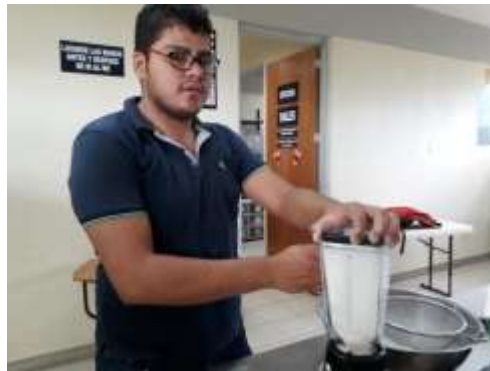
Figura 22. Proceso del polvo de malanga.

Al tener la malanga deshidratada, se introduce en una licuadora a alta velocidad para triturarla hasta un tamaño de partícula fina, para posteriormente poder ser tamizada.