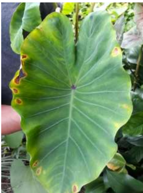
Figura 17. Hoja de malanga infectada de mancha parda.

Mancha parda: Ataca a las semillas como a las hojas y las plántulas, presentan manchas ovaladas en sentido longitudinal; al principio tienen un color claro con bordes difusos y posteriormente se oscurecen haciéndose los bordes más definidos (Dominguez, 1961).