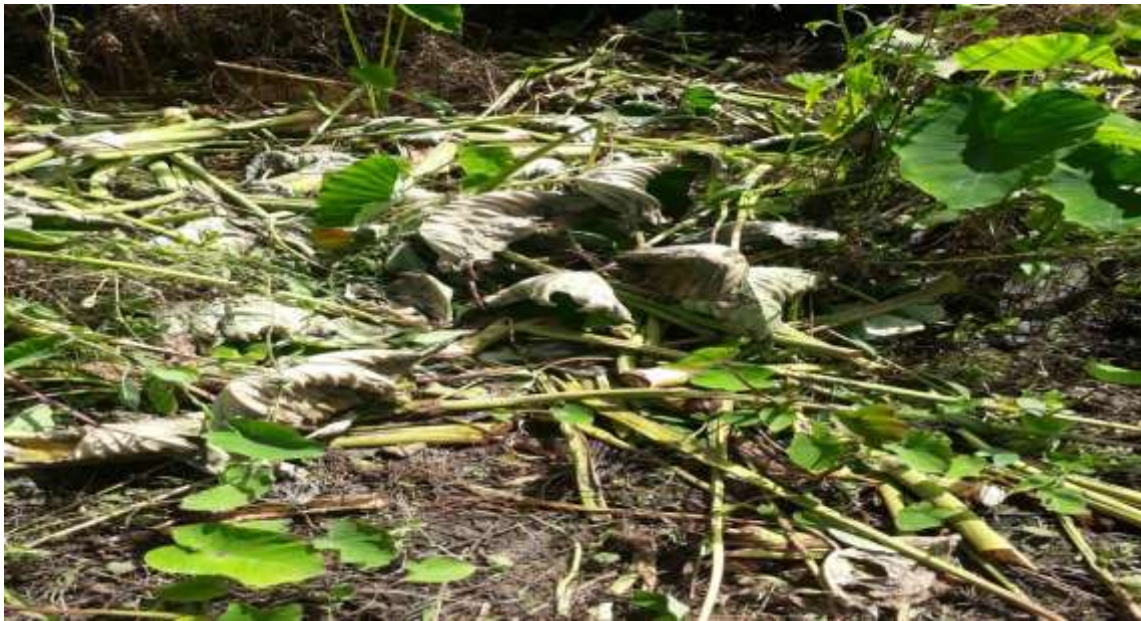
Figura 16. Cosecha infectada de podredumbre.