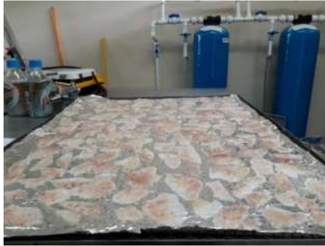
Figura 20. Malanga rebanada antes de ir al horno de secado.

Una vez escalfadas las rebanadas de malanga, se ponen en una lámina de papel aluminio esparcida para que no se peguen al momento del secado y se pone en una rejilla especial para el horno deshidratación.