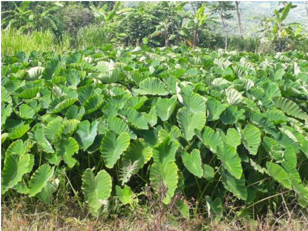
Figura 1. Cosecha de malanga.

Existen varias regiones en México, que cuentan con las condiciones adecuadas para la exploración y cultivo de la malanga, lo que puede hacerlo un gran producto con alto potencial para su implantación en el país (Actopan, 2012).