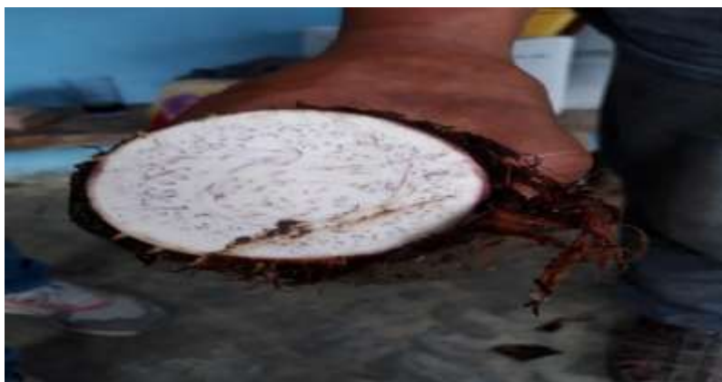
Figura 2. Fruto de la Malanga

Conocido como Malanga, comúnmente en los países como México, Colombia, Puerto Rico, Cuba y España, en Venezuela es conocida como Ocumo, en Panamá como Otoa, en República Dominicana como Yautía.