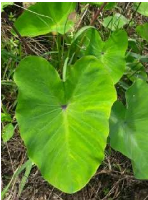
Figura 9. Vista de la hoja de la malanga

El peciolo es cilíndrico en la base y acanalado en la parte superior, mostrando una coloración que varía según el clon. Tiene una característica distintiva la presencia de líneas longitudinales amarillas o rosadas y de manchas o puntos rojizos a violáceo, hacia el centro de la base. El peciolo se inserta en la parte media del limbo de la hoja, la cual va directamente a los tres nervios principales; el ángulo que forma el peciolo con la lámina es característica varietal. El color varía del verde al verde-claro al verde-purpura.