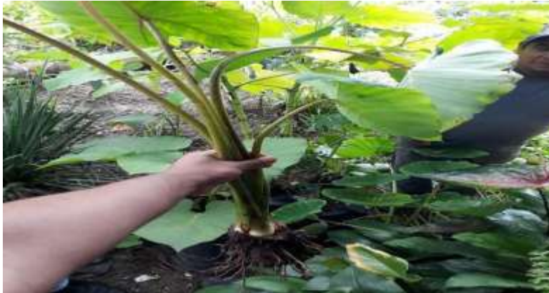
Figura 3. Tallo de la malanga.

Tallos: Los tallos son gruesos como forma de rizoma del que brotan tallos secundarios engrosados.