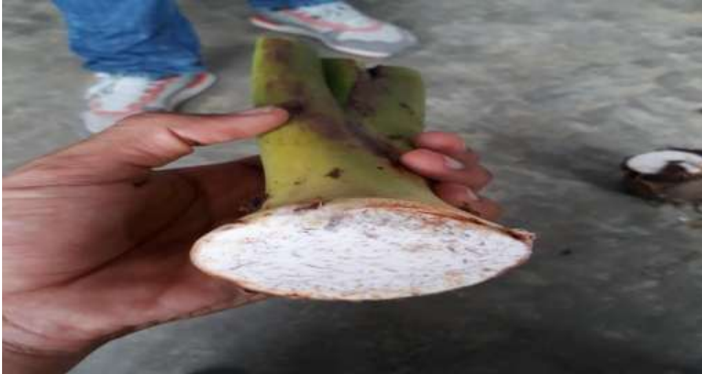
Figura 6. Raíz de la malanga.

El desarrollo de una planta de tubérculos llegan a producir las ya mencionadas yemas que pueden producir una nueva planta; es decir al plantar el taro con una yema, se consigue desarrollar una planta a partir de esta, eso debe a que la planta está en crecimiento se alimentan del tubérculo donde se originó hasta que consumen los nutrientes y lo descomponen, a medida que crece la planta desarrolla más raíces y a su vez originan más tubérculos (SL, 1999-2017).