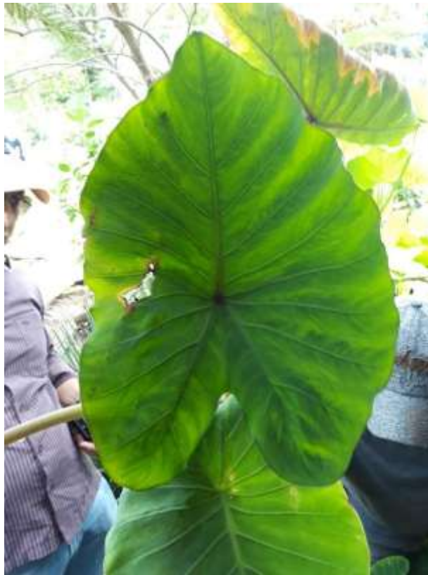
Figura 18. Hoja consumida por el gusano cortador.

Los gusanos cortadores exhiben dos tipos de patrones de alimentación dependiendo de la cantidad de humedad en el suelo y del tamaño de las plantas; donde hay humedad adecuada de suelo y las plantas son pequeñas, las larvas se ocultan en el suelo durante el día y se mueven a la superficie del suelo a la noche donde cortan las plantas que apenas están sobre la superficie del suelo. (Tooker, 2009)