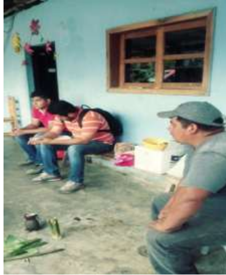
Figura 11. Entrevista a productor de malanga en Cuauhtémoc, Chiapas.