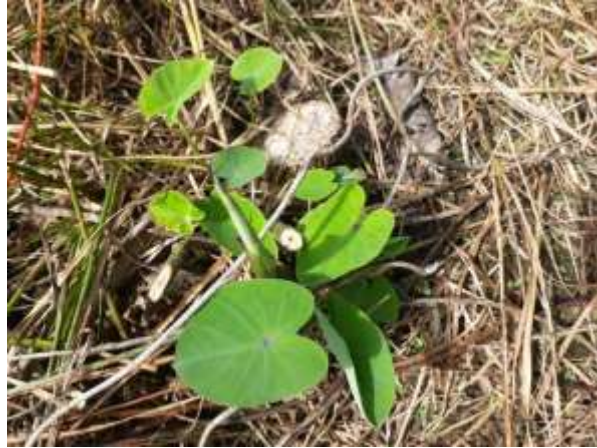
Figura 13. Raíz de malanga a las pocas semanas de ser sembrada.

Siembra de las yemas: Las yemas deben sembrarse con la punta hacia abajo a una profundidad de 1 a 2 cm.