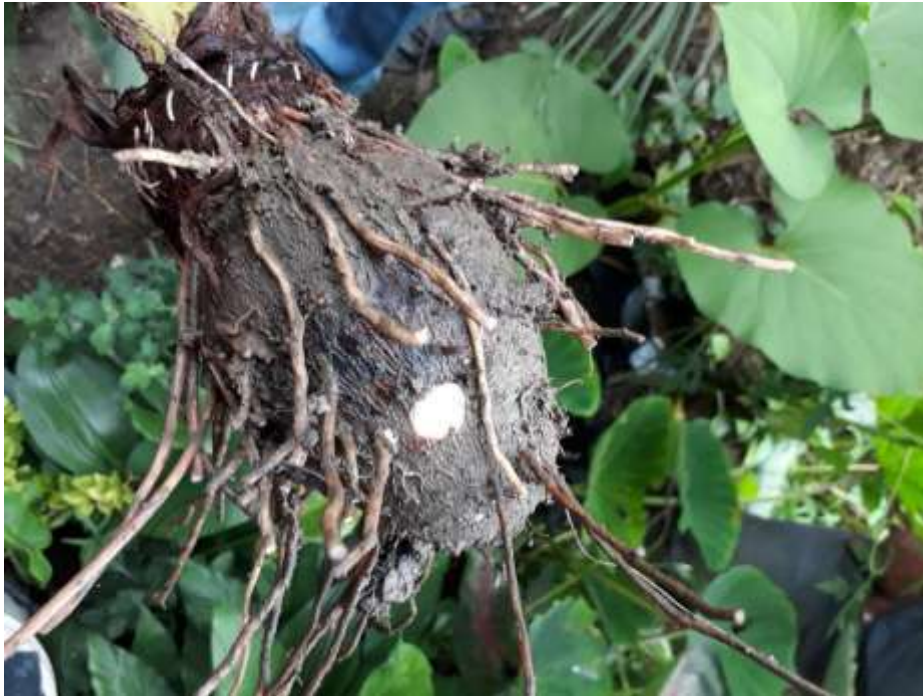
Figura 5. Yema de la malanga (lo podemos observar como pequeños bultos).

Ojos o yemas: Las plantas producen yema (a partir de las yemas se desarrollan nuevos brotes). Raíces que desarrollan los tallos subterráneos, sembrando la raíz nuevamente crece la malanga.