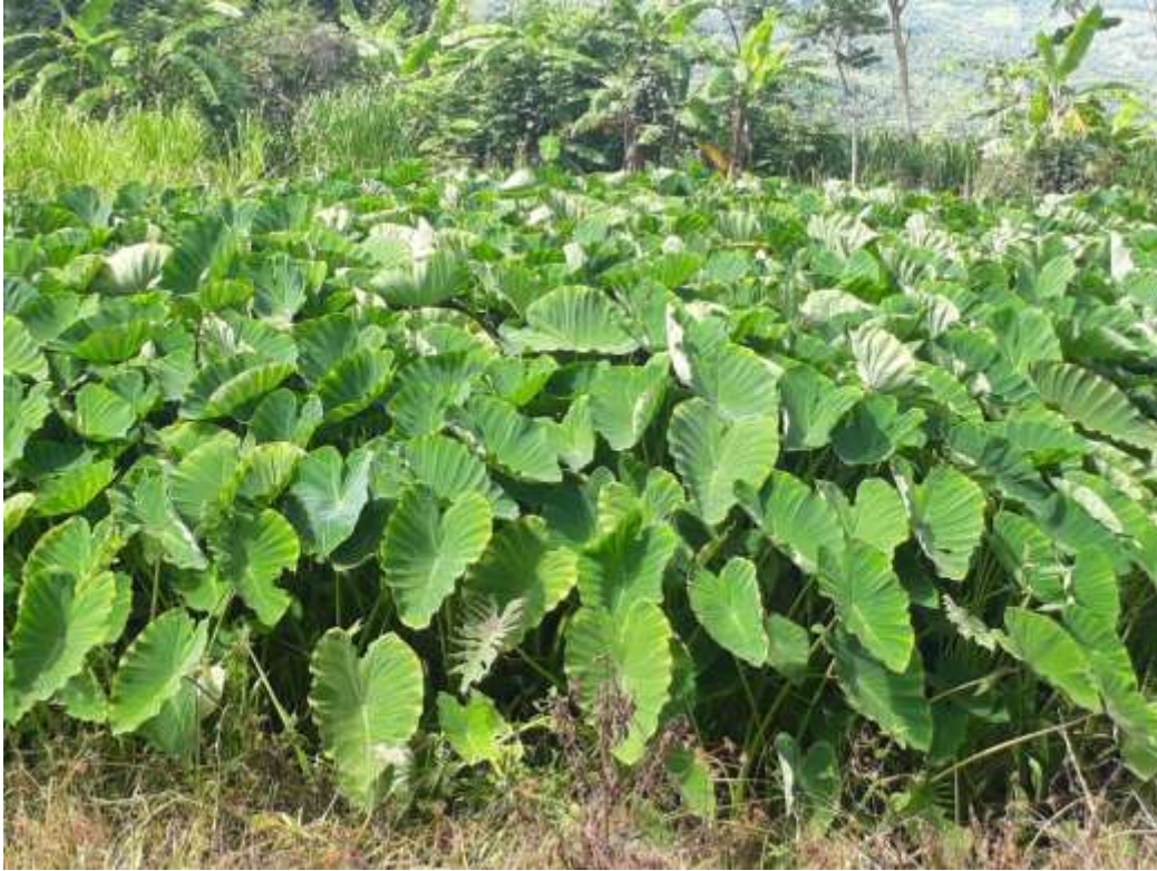
Figura 14. Cosecha de malanga con 7 meses.