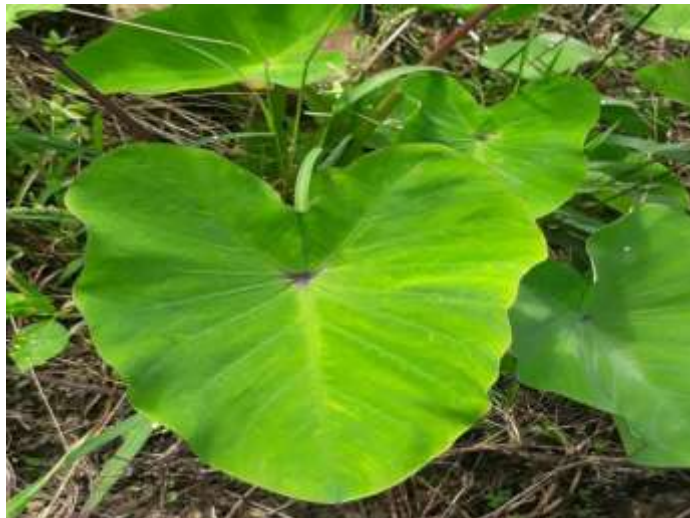
Figura 4. Hoja de la malanga.

Hojas: Del tallo principal nacen varias hojas grandes, de forma sagitada, erecta con largos pecíolos acanalados de color verde en donde al centro de la hoja encuentra un punto color rojizo, la hoja llega a medir entre 12 y 15 cm.