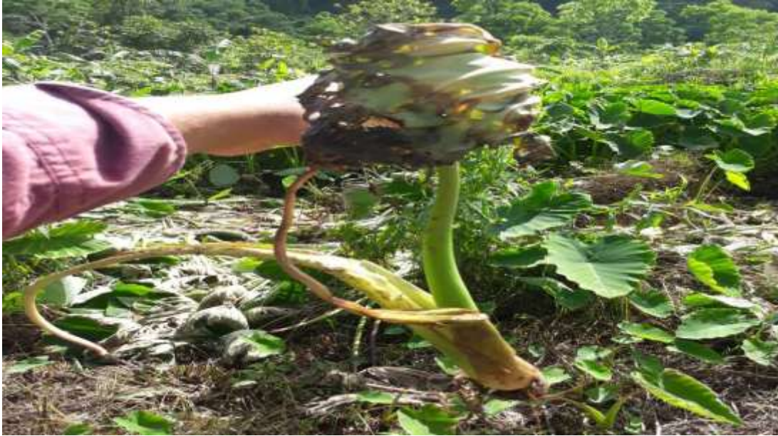
Figura 15. Malanga infectada de podredumbre.