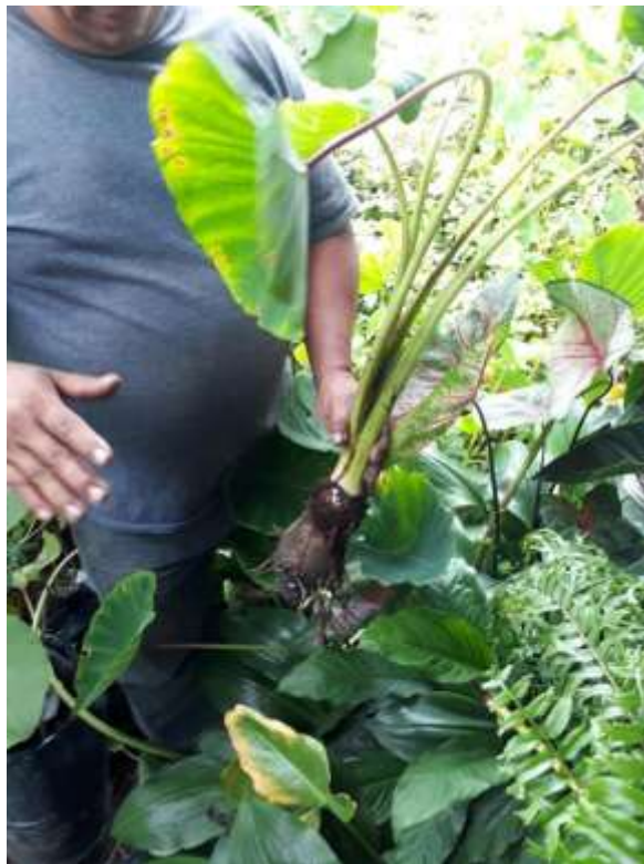
Figura 10. Vista completa de la malanga.

La duración del ciclo de crecimiento es de entre los nueve a once meses, durante los seis primeros meses se desarrollan los cormos y hojas, en los últimos cuatro meses el follaje se mantiene estable y al comenzar a caerse las plantas están listas para la cosecha de cormelos. En las siembras comerciales la cosecha se realiza a los diez meses para la malanga blanca y doce meses para la malanga morada.